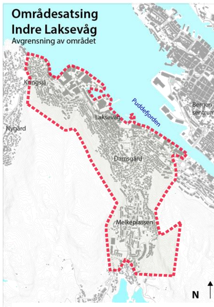
Illustrasjon: Bergen kommune

Rapporten «Levekår og helse i Bergen 2011» viser en samleindeks for Indre Laksevåg på 8,5 (skala 1-10), den nest høyeste samleindeksen når en sammenligner øvrige områder i Bergen. Flere faktorer skiller seg ut med en indeks som er dårligere enn samlet snitt i kommunen. Dette gjelder median bruttoinntekt, utdanningsnivå, sosialhjelp til unge, barnevernstilfeller, barnefattigdom, barneflytting og andel av befolkning som er mistenkt, siktet eller domfelt for forbrytelser. I Levekårsrapporten 2016 viser tallene bedring eller uendret status siden 2011.