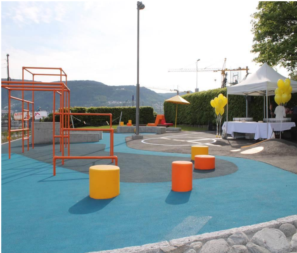
Parkouranlegget på Leitet

Områdesatsingen har bidratt med finansiering, koordinering av medvirkningsprosesser og samarbeid med ulike etater for å få en etablering og oppgradering av fellesområder som møte- og lekeplasser, grøntområder og snarveier. Eksempler på dette er lekeplassene i Frydenbøveien, Arne Abrahamsens vei og parkouranlegget på Leitet. Oppgradering av en ballplass og enda en lekeplass har byggestart høsten 2016.