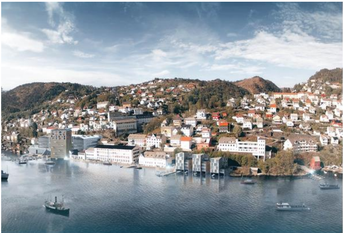
Illustrasjon: Asplan Viak

I 2015 ble det startet opp et eget språksatsingsprosjekt i Ytre Arna. Bakgrunnen er svake leseresultater ved Ytre Arna skole, og prosjektgruppen inkluderer representanter fra skoler, barnehager, bibliotek, PPT, helsestasjon og kulturkontor. Gjennom prosjektet er det satt inn en rekke tiltak utover de ordinære tjenestene, spesielt rettet mot de yngste barna og deres foresatte. Det har blant annet blitt startet opp Lesefrø (utplasserte «minibibliotek» i barnehagene og på helsestasjon), barseltreff på biblioteket, oppfølgingsmøte for foresatte med 4-åringene, ekstraordinære overgangsmøter mellom barnehager og skole og jevnlig Barnelørdager med teaterforestillinger for de yngste.