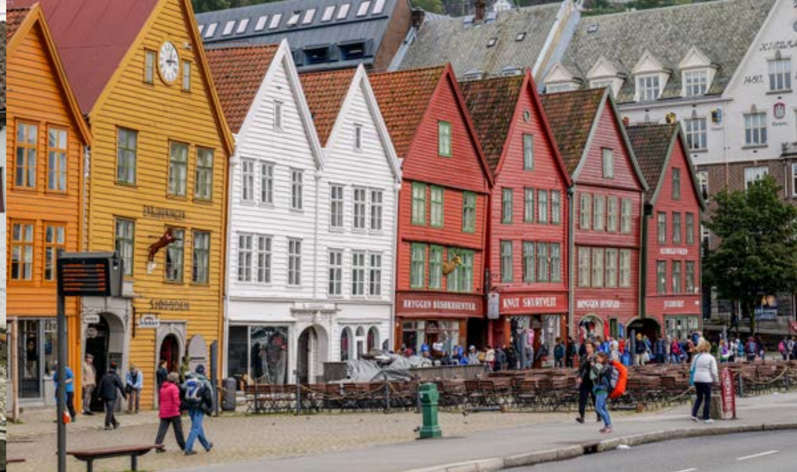
Det eldste av Bryggen mot Strandsiden og Torget, utgjør gårdrekke som har følgende navn: Bugården (ikke i bildet), Nordre og Søndre Bredsgård (som vi ser såvidt til venstre i bildet), Enhjørningen, Svensgården (hvit dobbelgård), Hjordtegården (Jacobsfjorden), Bellgården, Nordre og Søndre Holmedalsgård.

det opprinnelige Bryggen er tilstrekkelig til å gi en opplevelse av middelalderens havnekarver, og viser også Bryggens tilknytning til bebyggelsen rundt og dens plass i det urbane bylandskapet. Finnegården (Hanseatisk museum) er en del av verdensarven og viser også den opprinnelige avgrensingen av bebyggelsen mot sør. Autentisiteten, slik den er beskrevet på verdensarvlisten, er i stor grad knyttet til struktur og materialbruk, og til tradisjonshåndverket som praktiseres i restaureringsarbeidet. Restaureringen av Bryggen startet for alvor på 1960-tallet, og har siden opprettelsen av Prosjekt Bryggen tidlig på 2000-tallet hatt et stort fokus på de opprinnelige byggematerialene og byggeteknikkene. http://prosjektbryggen.no/