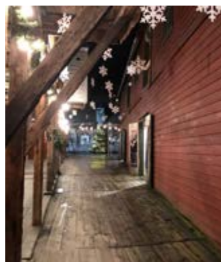
De enkle gårdene utgjorde én lang rekke, med oppganger til andre etasje forsynt med svalgang over passasjene.