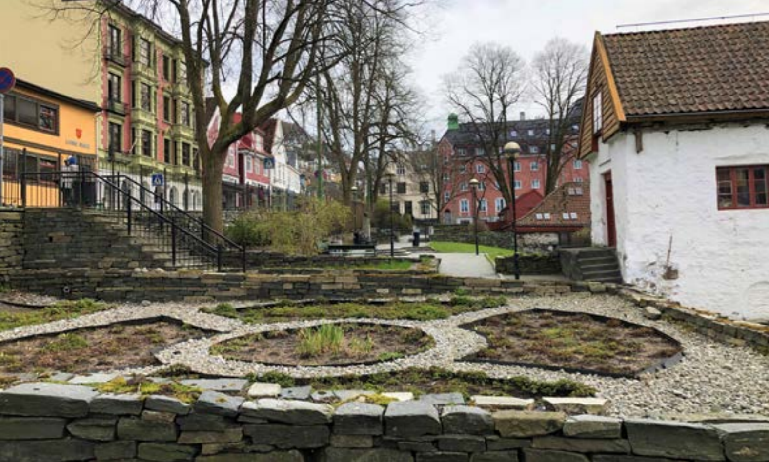
Bryggehagene i området bak gårdene på Bryggen og Øvregaten. I middelalderen var dette området brukt som kålhager. I 1989 ble det på ny anlagt hager her. I forgrunnen ser vi et "regnbed" som skal sikre infiltrasjon av overflatevann i grunnen under Bryggen. Slik forhindres det at oksygen slipper til og fremskynder nedbrytingen av de organiske kulturlagene under den stående bebyggelsen.