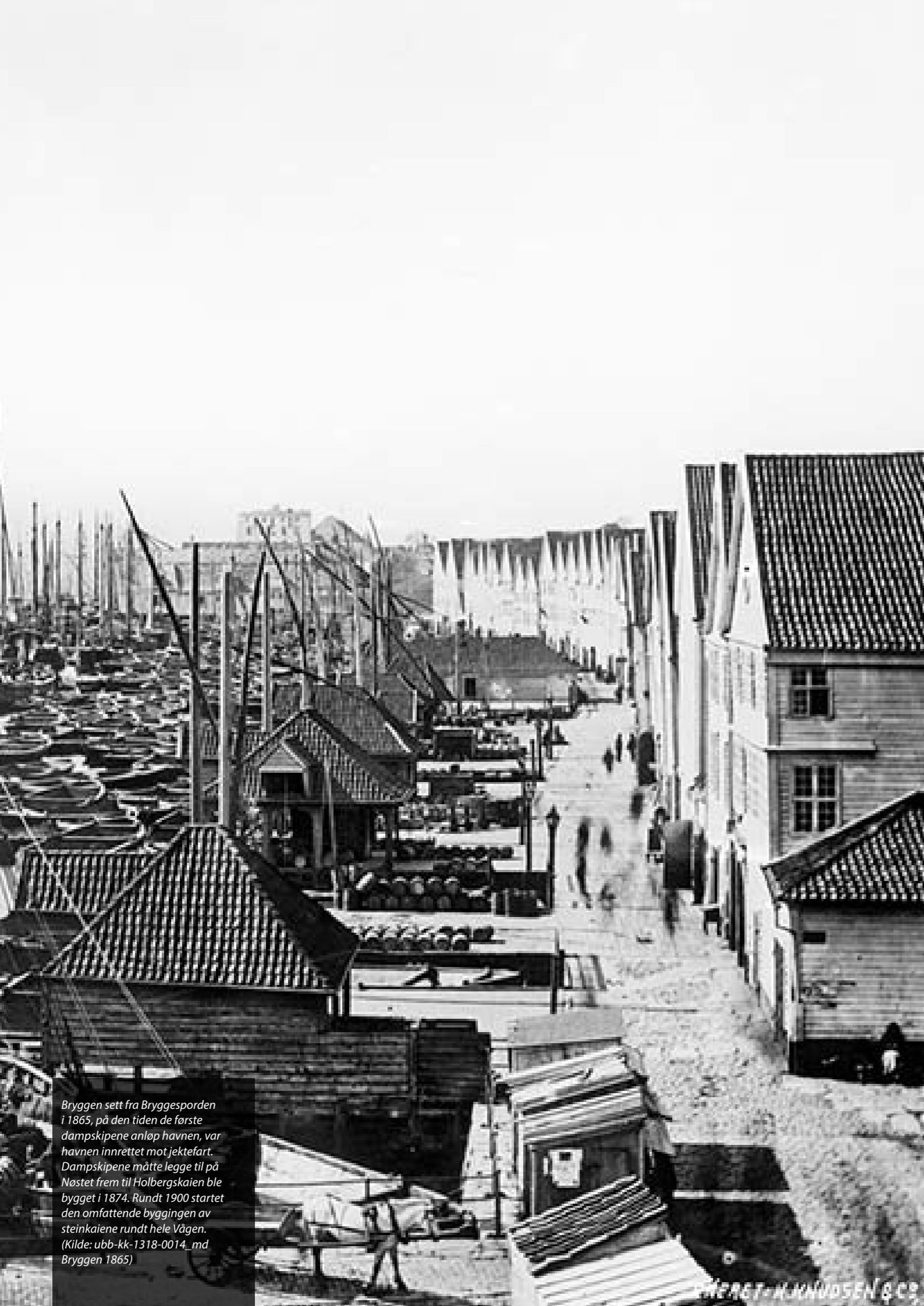
Bryggen sett fra Bryggesporden i 1865, på den tiden de første dampskipene anløp havnen, var havnen innrettet mot jektefart. Dampskipene måtte legge til på Nøstet frem til Holbergskaien ble bygget i 1874. Rundt 1900 startet den omfattende byggingen av steinkaiene rundt hele Vågen.