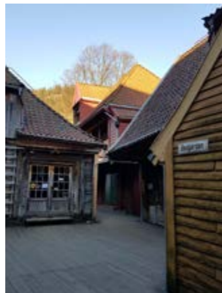
De fleste gårdene på Bryggen var doble og omfattet to lange rekker bygninger med en smal passasje mellom fra sjøsiden og opp mot Øvrevegaten. I de bakre delene var det boliger, lagere, skjøtstue og ildhus.

I verdensarvsammenheng snakker man om verdensarvstedets autentisitet og integritet. For Bryggen er integriteten her knyttet til at den gjenværende delen av