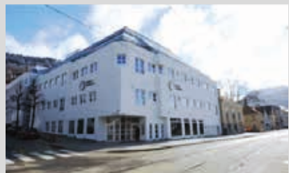
Innbyggerservice, Kaigaten 4.

ኣብ Kaigaten 4 ዝርከብ Innbyggerservice ፊት Byparken ዝርከብ ተረከብ ወይ ከኣ 55 56 55 56 ደውል። ውልቃዊ ቀጽሪ መንነት ኖርወይ ዘይብልካ እንተኸይንካ ንኸተመልከት እውን ኣብዚ ይሕግዙኻ ኢዮም።