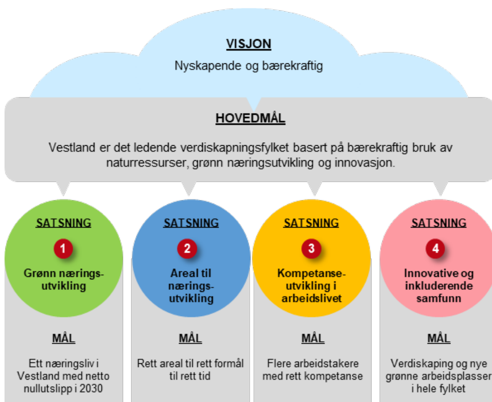
Figur 1: Regional plan for innovasjon og næringsutvikling 2021-2033 - mål og satsinger

Regional plan for innovasjon og næringsutvikling har 4 hovedsatsinger (figur 1), med tverrgående tema for alle satsingene som inkluderer: (i) samhandling og møteplasser, (ii) internasjonalisering, (iii) forskning og innovasjon, (iv) infrastruktur og digitalisering og (v) innovasjonsinfrastruktur.