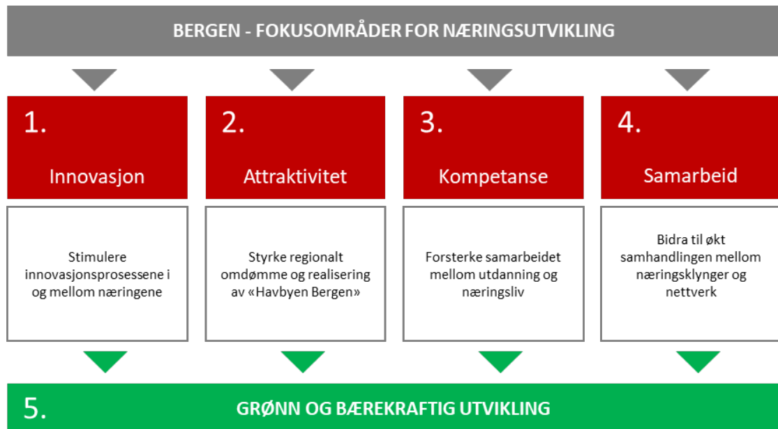
Figur 3: Fokusområder for næringsutvikling i Bergen kommune.

Bergen kommune kan bidra betydelig til grønn og bærekraftig omstilling av næringslivet ved å tilrettelegge for økt innovasjon og entreprenørskap, realisere Havbyen Bergen, sørge for riktig kompetanse til riktig tid samt å være pådriver for økt grad av samhandling og samarbeid (figur 3).