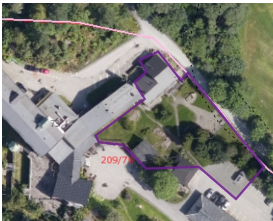
Figur 1: Barnehagens plassering på tomten er omtrentlig markert med lilla.

Barnehagen bruker nærområdene til turmål, og drar på utflukter med egen buss. Både små og store barn er utenfor barnehagens inngjerdete område flere ganger i uken, men de små er ikke på turer når nye barn er på tilvenning. Styrer opplyser at barna er innendørs omtrent 1-2 timer per dag, resten av dagen er de ute. Ved alle befaringer av barnehagen har barna for det aller meste vært utendørs.