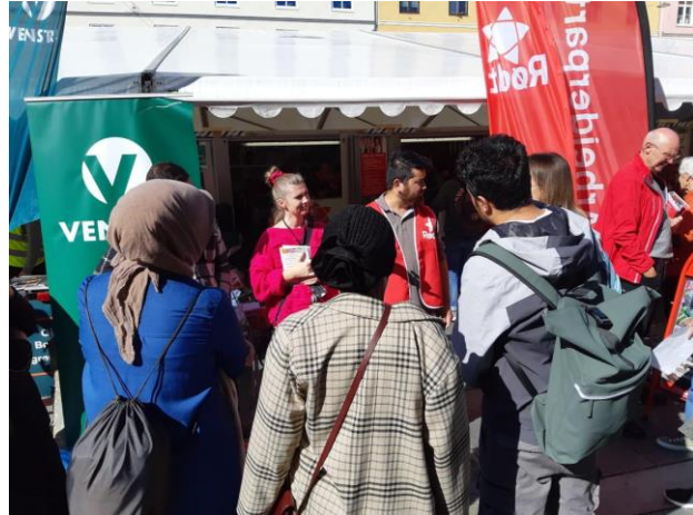
Besøk av valgkodene på Torgallmenningen

Samfunn og kultur er en gruppe hvor vi har involvert og invitert både samarbeidspartnere og nyttige tjenester og tilbud som kan være aktuelle for deltakerne våre. I 2023 har blant annet Rettleiingstenesta, Bergen Sanitetsforening, Barne- og familiehjelpen Årstad og Bergenhus, Arbeidstilsynet og SUA, Juss formidlingen, Frisklivscentralen, Entreprenørny Nettbasert etablererkurs, Løvsstakken og Møllaren frivilligsentral SEIF Selvhjelp for innvandrere og flyktninger. Vi var også ute med gruppen og besøkte Robin Hood huset, Innbyggjerservice, og Lokalt. Vi holdt og foredrag for deltakerne våre om vold i nære relasjonar, økonomi og flere andre viktige temaer. Før kommunevalget var vi på Torgallmenningen og besøkte valgkodene der. Dette er viktig da NorA sin deltakergruppe er av de som bruker stemmeretten sin minst.