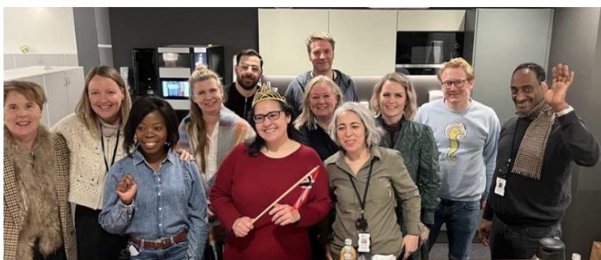
De ansatte i NorA samlet i NorA sine lokaler