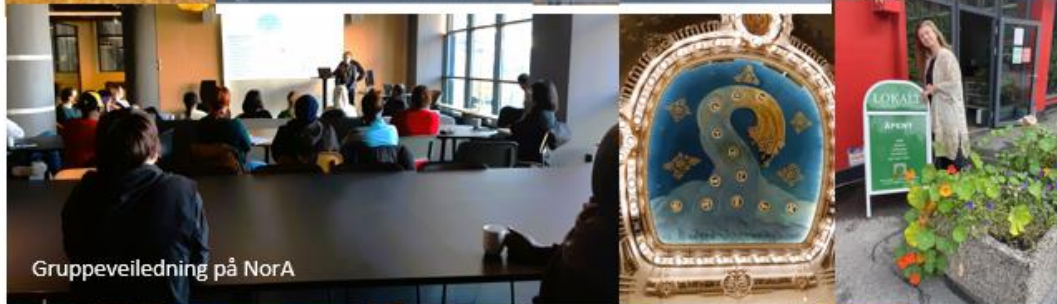
Gruppeveiledning på NorA