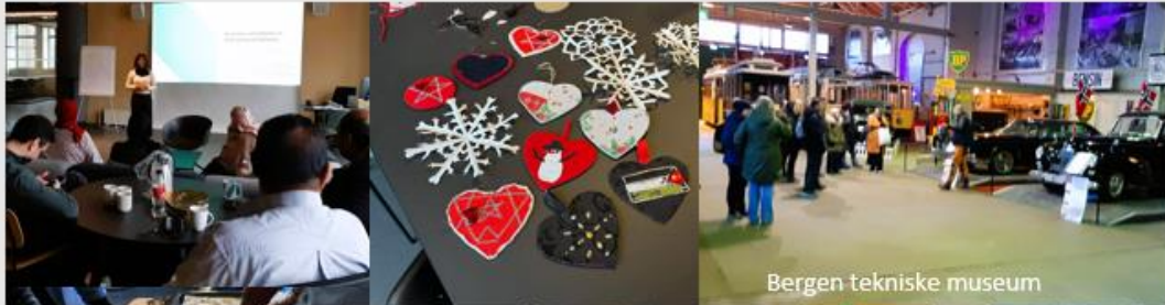
Bergen tekniske museum