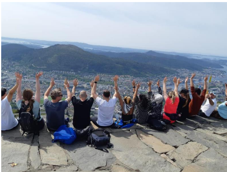
Walk & Talk på Ulrikens topp våren 2023

Walk & Talk er et gruppetilbud som hver fredag gjennom hele 2023 har tatt med seg deltakere på tur i Bergensområdet. Målet er å snakke norsk sammen med andre deltakere og med veiledere. Ved at vi har hatt med flere veiledere, og rullert på hvem som er med, gir det veiledere gode anledninger til å bli bedre kjent med deltakerne sine på en annen måte enn ved å bare møtes på et møterom.