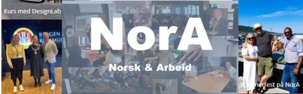
Kurs med DesignLab