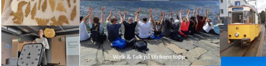
Walk & Talk på Ulrikens topp