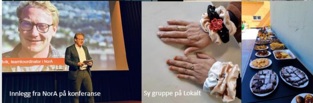
Innlegg fra NorA på konferanse