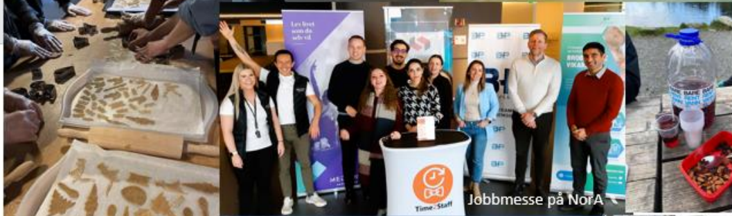
Jøbbmesse på NorA