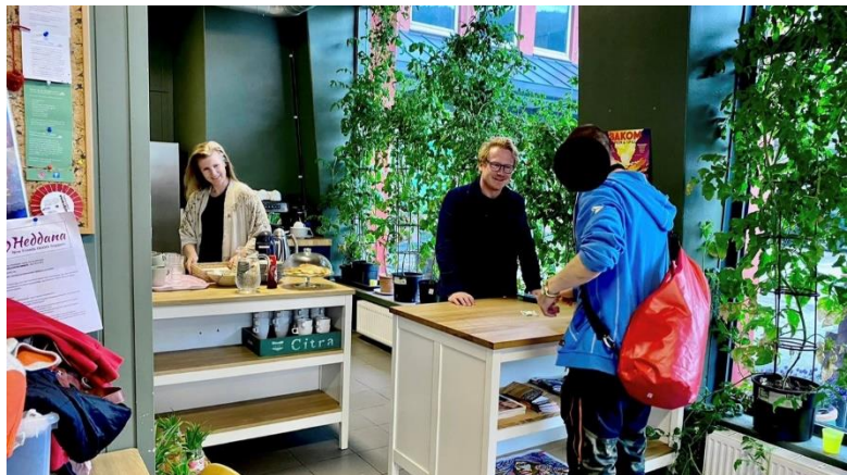
Bærekraftige liv på Danmarks plass

To ansatte fra NorA har ansvaret, hvorav en er fast og fungerer som arbeidsleder og den andre er på rulling i ansattgruppen til NorA. Lokalt er et aktivitetshus med både butikkdrift (salg av brukte klær), kjøkken og mulighet til å drive kafé, i tillegg til sy-kurs. NorA sine deltakere har derfor mulighet til å teste ut ulike arbeidsoppgaver, og fokuset rettes mot mestring, kompetanseheving og språktrening.