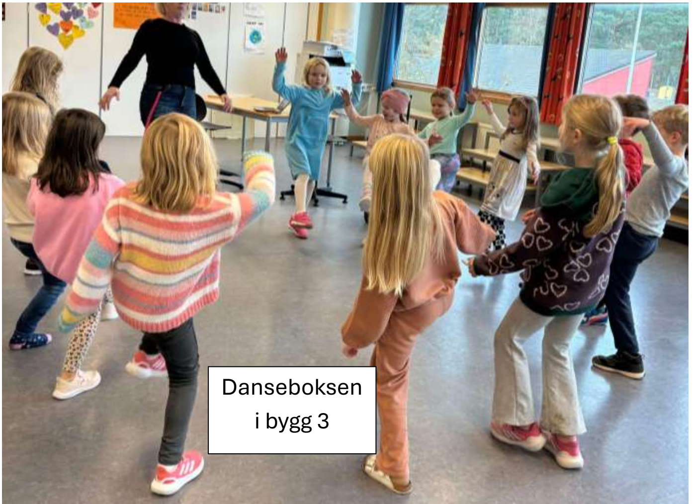
Danseboksen i bygg 3