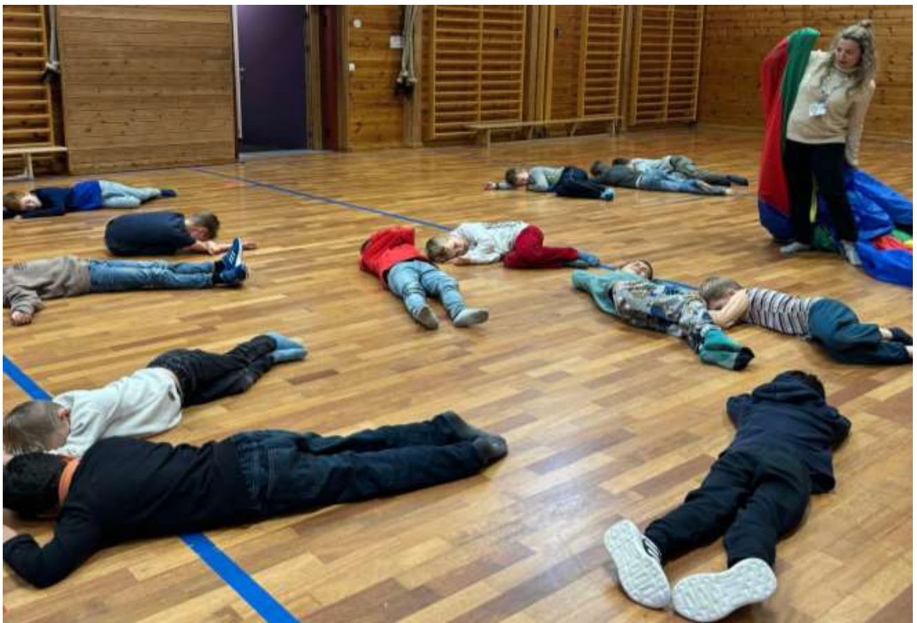
Lek i gymsal