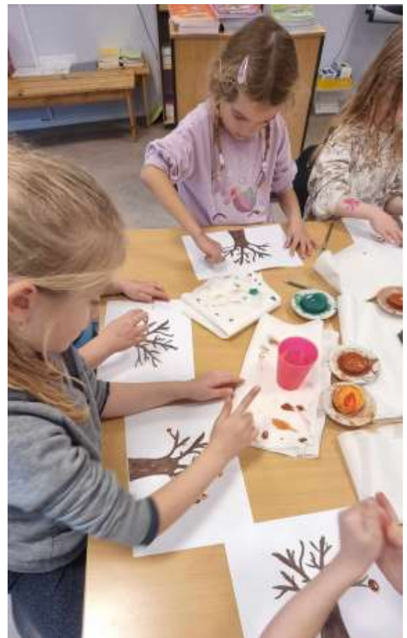
Vi lagde tulpaner i høstfarger ....