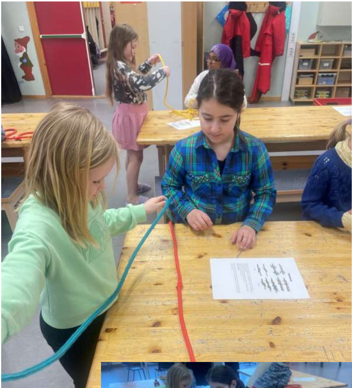
Friluftsgruppen øvde seg på ulike typer knuter