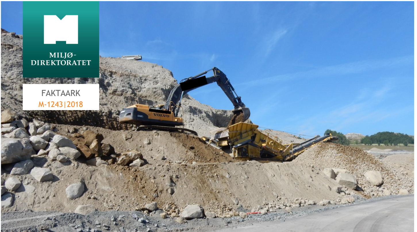
Foto: Tone Ankarstrand, Fylkesmannen i Rogaland. NB: bildet er manipulert