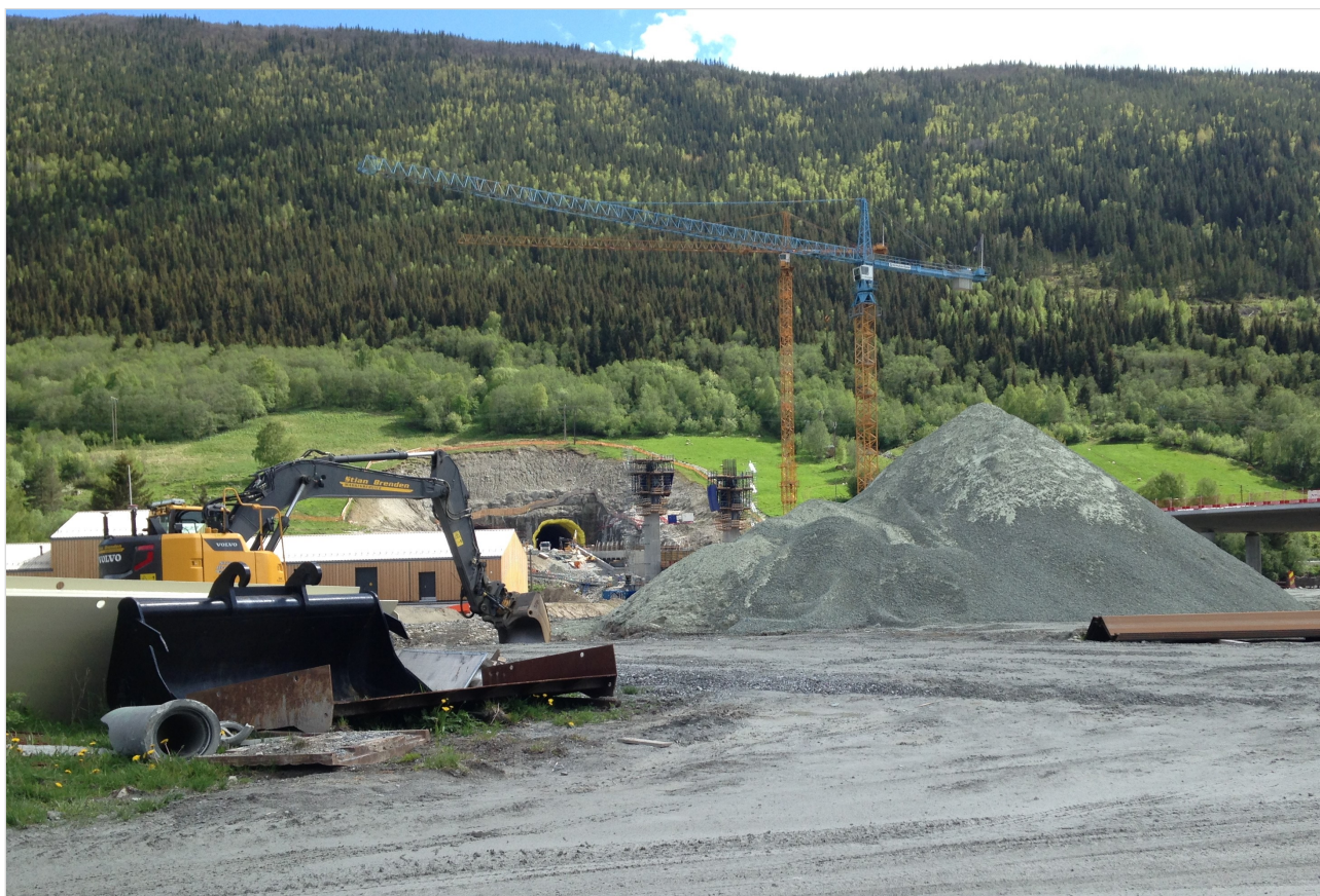
Større samferdselsprosjekter genererer ofte store mengder overskuddsmasser.