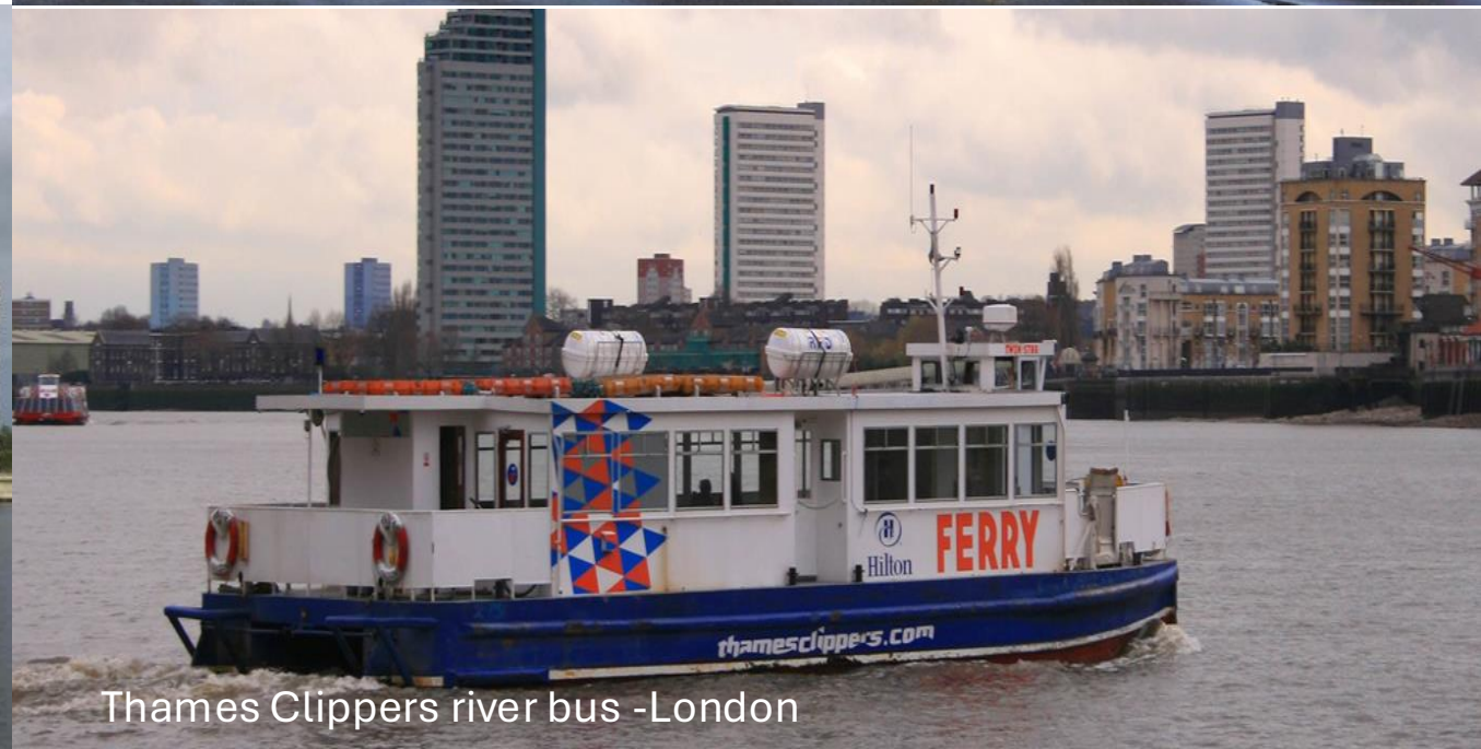
Thames Clippers river bus -London