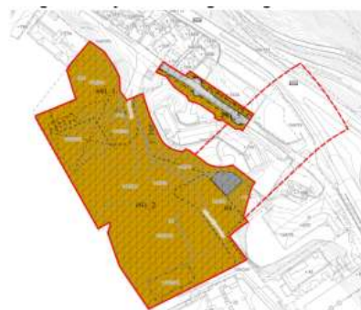
Figur 2 Utsnitt fra regulert situasjon (arealplan-ID 70670000)