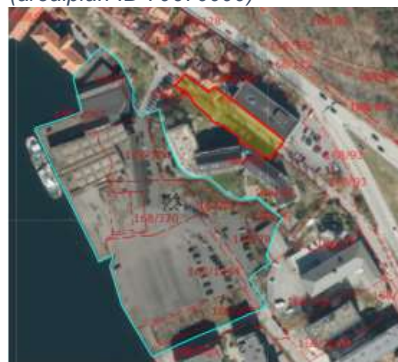
Figur 3 Utsnitt fra flyfoto

Opphevingsarbeidet ble vedtatt igangsatt i byrådet 14.11.2024 i sak 1298/24.