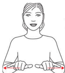
Is (på bakken)