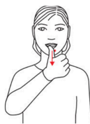
Is (til å spise)