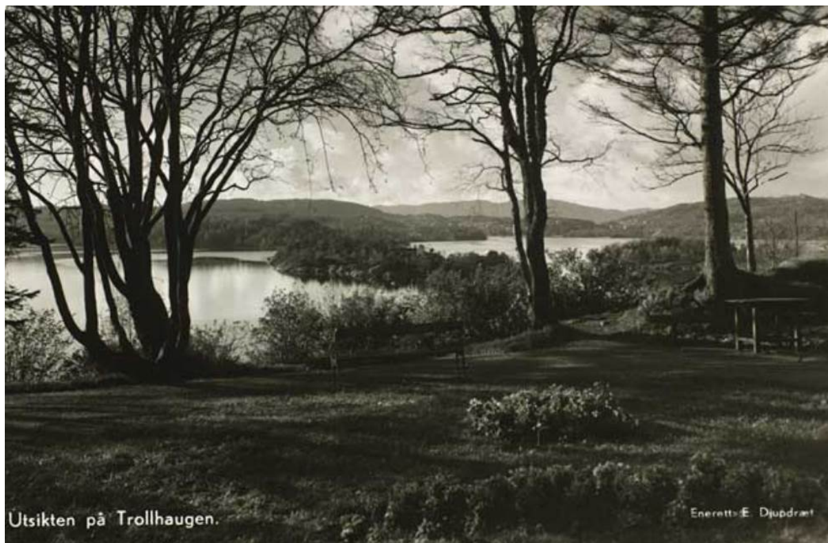
Figur 20: Utsikt på Troldhaugen. Ukjent tidspunkt.

mange brukerne av Troldhaugen og deres ulike behov. Uteområdet ved Troldsalen er opprustet i 2014/2015 med ny tilkomst fra museumsbygget og bedre tilpassede adkomstveier for alle.