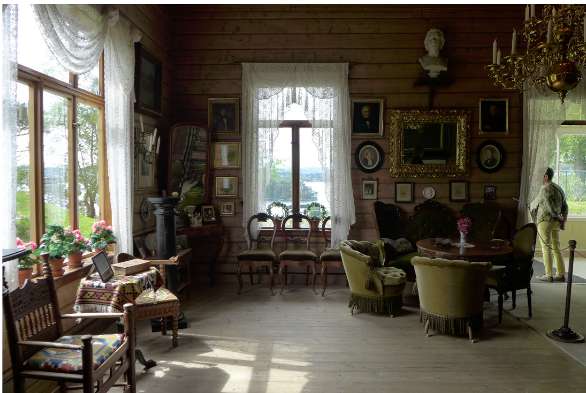
Figur 15: Dagligværelse/stue i villaen på Troldhaugen.