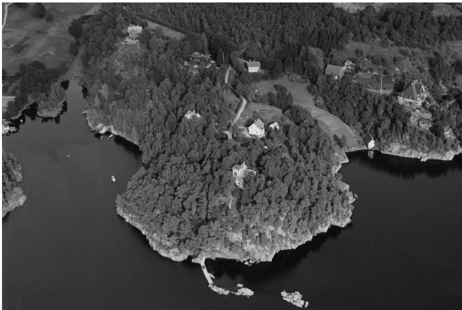
Figur 2: Oversiktsbilde av Troldhaugen i 1931.

Hele eiendommen Troldhaugen er i dag regulert til spesialområdet bevaring. Troldhaugen ble åpnet som museum allerede i mai 1928. Siden museumsreformen i 2006 har Edvard Grieg Museum Troldhaugen vært drevet som en del av KODE- Kunstmuseene i Bergen. Troldhaugen består i dag av villaen, komponisthytten, ekteparets gravsted og hagen, i tillegg til et moderne museumsbygg (1995) og konsertsalen Troldsalen (1985/2012/2014).