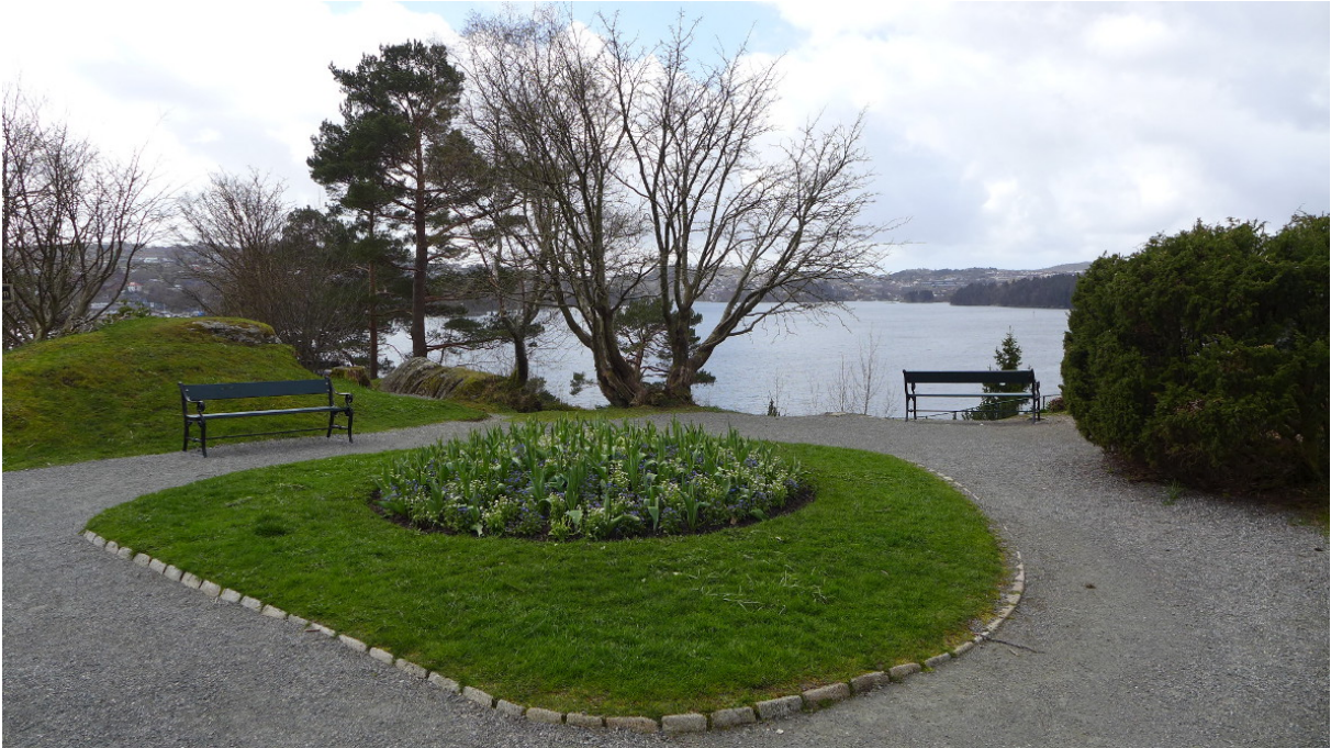
Figur 22: Fra den mer formelle hagen utenfor verandaen på villaens vestside.