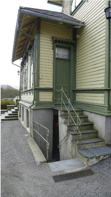
Figur 11: Fasade øst. Bitrapp som opprinnelig førte inn til sval og kjøkken. Kjellernedgang.