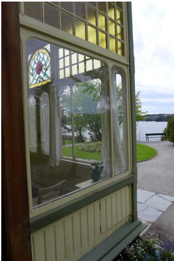
Figur 10: Utsikt fra spiseværelset mot Nordåsvannet gjennom verandaen med rosevindu fra 1906.

På villaens nordvestre hjørne er det markante tårnet plassert. Et slikt utkikkstårn er et av bygningstrekkene ved Troldhaugen som har klare internasjonale forbilder. Tårnet som arkitektonisk motiv, var mye brukt i europeisk villaarkitektur, og kjennes også fra 1800-talls bebyggelse i USA. Også Ole Bulls Lysøen har et slikt hjørnetårn, om enn litt mer utartet i formen enn Griegs enkle hjørnetårn. Tårnet er kvadratisk og følger videre opp fra hushjørnet i 1. etasje.