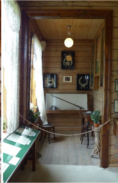
Figur 18: Minnerommet består av det opprinnelige kjøkkenet og pikeværelset som vi her ser inn i..