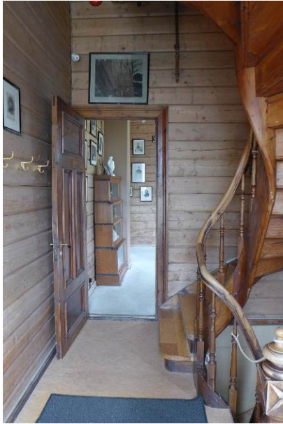
Figur 17: Villaens entré med trapp opp til annen etasje og inngang til minnerom (tidligere kjøkken).