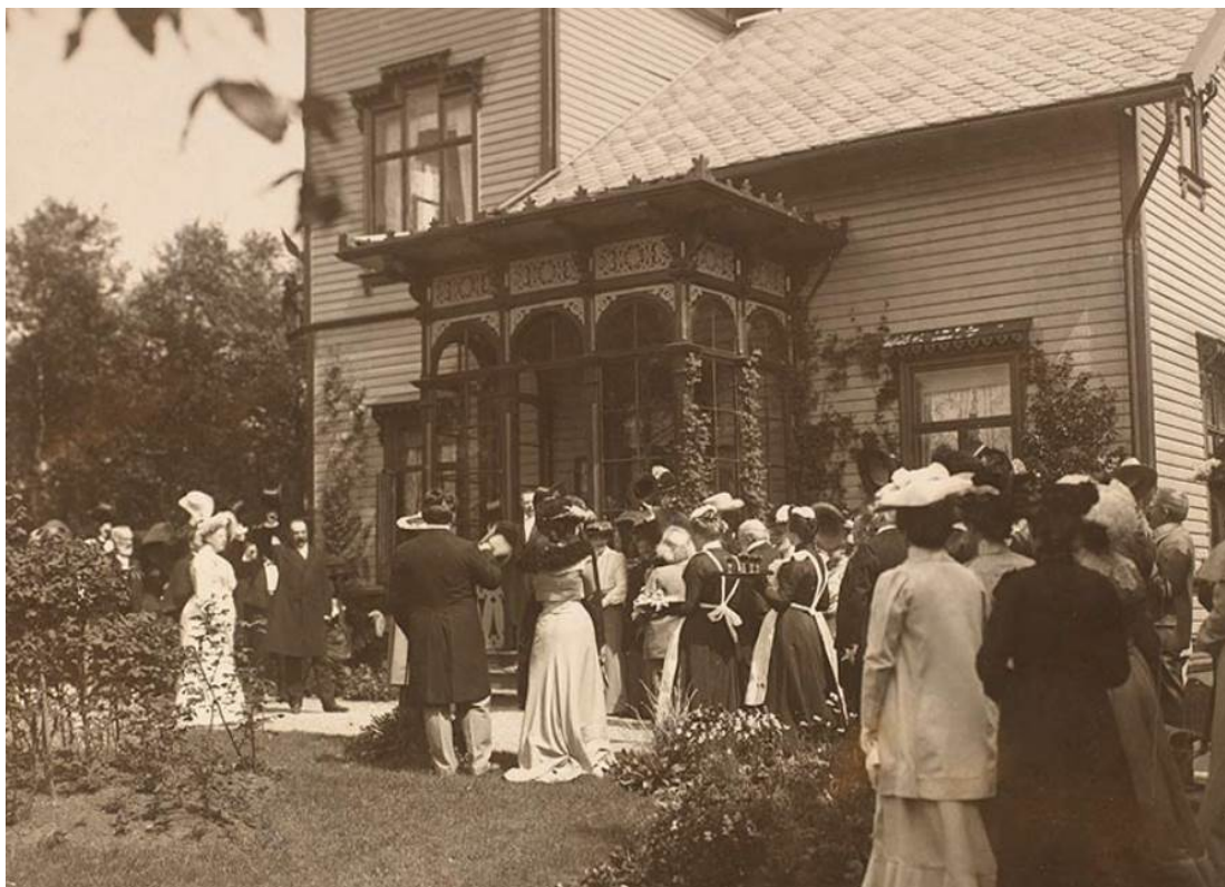
Figur 4: Edvard Grieg sin 60-års dag på Troidhaugen i 1903.

Samtidig var det, mot slutten av 1800-tallet, en ganske markant utflytting blant borgerskapet fra sentrum til nye villastrøk utenfor byen. Dette gjelder ikke bare Bergen, men var en trend i tiden som var vel kjent fra byområder i Norge-Sverige. Ønsket om helsebringende frisk luft og yndig natur, sammen med god plass og rammer rundt sosial omgang, stod sterkt. Likeledes stod den nasjonalromantiske drømmen sterkt. Den friske, ville og genuine norske naturen, et romantisert bygdeliv med støler og stuer, og ikke minst folkekunst, er kjent fra både musikk, malerkunst, brukskunst og litteratur fra perioden. Det var også klare sosiale konvensjoner og koder for hvordan man skulle bo og leve i disse omgivelsene, og både byggherre og arkitekt var vel kjent med disse fra barnsben av.