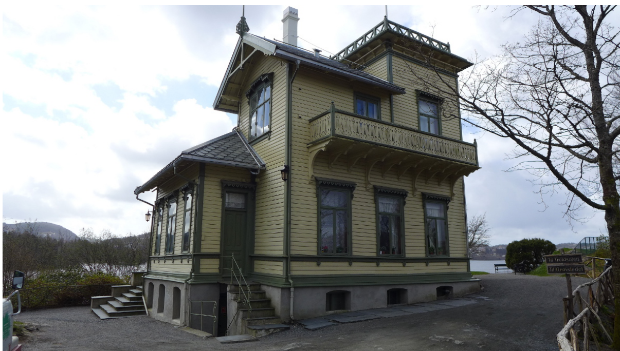
Figur 8: Fasade mot nord med veranda utenfor tårnværelset.