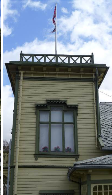
Figur 13: Tårnet på villaens nordvestre hjørne.