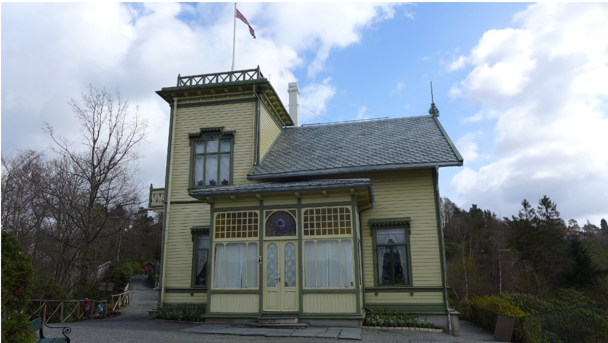
Figur 7: Fasade mot vest med innbygget veranda og Ninas rosevindu (Foto: Byantikvaren 2015).

Troidhaugen bærer mange trekk fra samtidens sommervillaer, hvor «utkikkstårnet» er et av de karakteristiske trekkene. Villaen er tegnet av Schak Bull (1858-1956) som tegnet en rekke villaer og forretningsgårder i Bergen. Villaen har noen detaljer i sveitserstil, men er i større grad utformet i et internasjonalt historistisk formspråk knyttet til villaarkitektur og kan ikke uten videre betegnes som et sveitserhus.