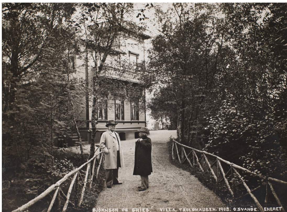
Figur 5: Bjørnstjerne Bjørnson og Edvard Grieg på Troldhaugen i 1903.

Museumsbygningen og Troldsalen er nye bygninger som er tilpasset Troldhaugens topografi og karakter. Byggene avlaster den historiske villaen og løser viktig infrastruktur rundt museet og en viktig internasjonal konsertarena. Troldsalen er ombygget og opprustet i 2012 og i 2014-2015. Disse bygningene har isolert sett liten antikvarisk interesse og vil ikke bli nærmere omtalt i denne rapporten.