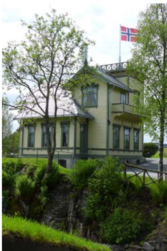
Figur 3: Troidhaugen en junidag. Troltsalen i bildets forkant.

Villaen på Troidhaugen stod ferdig i 1885. Arkitekt var Schak Bull (1858-1956), Edvard Griegs yngre fetter, men også en av samtidens fremadstormende og toneangivende arkitekter i Bergen.