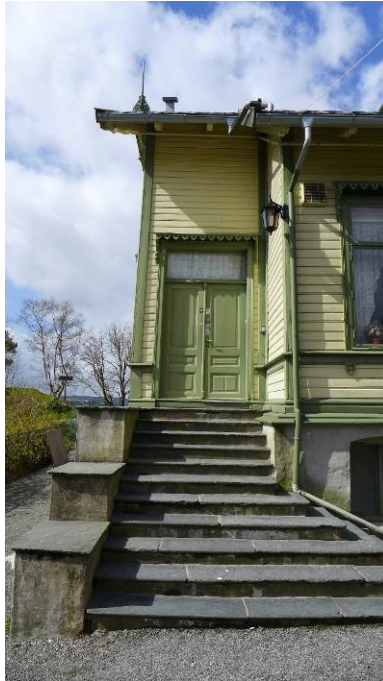
Figur 12: Hovedinngang på østfasaden.