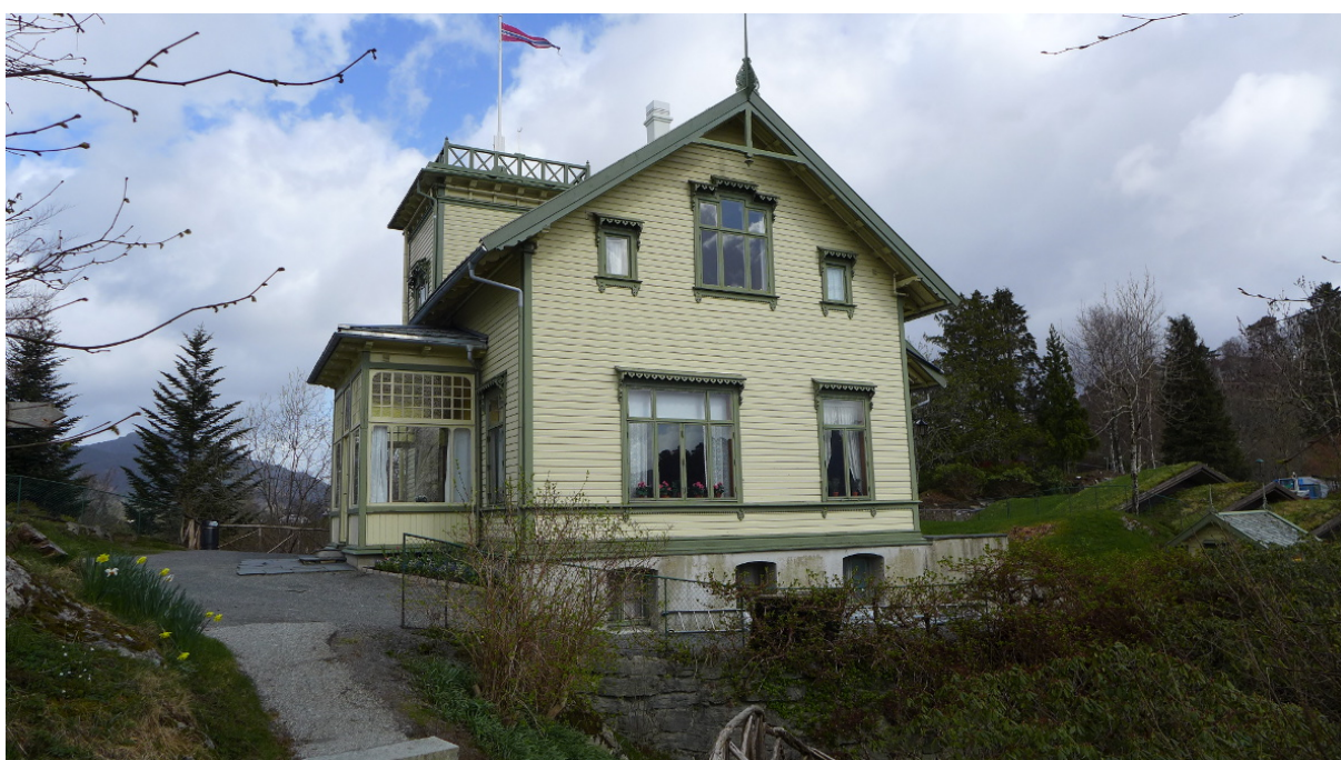
Figur 9: Fasade mot sør. Troldsalen og den lille boden skimtes til høyre i bildet (Foto: Byantikvaren 2015).

Villaen har en additiv usymmetrisk utforming med en enkel hovedform med to tverrstilte volum tett sammen, omsluttet av forskjellige arkitektoniske element på tre sider. Mot øst er inngangsdøren plassert helt mot sør på fasaden med en asymmetrisk trapp opp til den doble