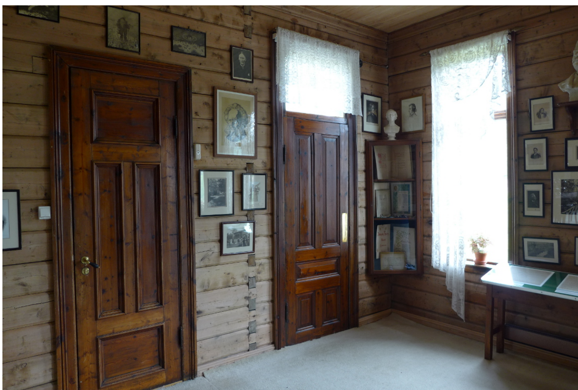
Figur 16: Dette værelset var opprinnelig kjøkken, men ble gjort om til minnerom i forbindelse med at museet ble etablert i 1928. Utgangsdør fra kjøkkenet til høyre.