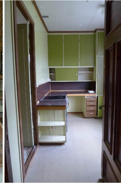
Figur 19: Det ble innredet vaktmesterleilighet i 2. etasje på 1950-tallet. Her fra kjøkkenet, opprinnelig del av gjesteværelse.