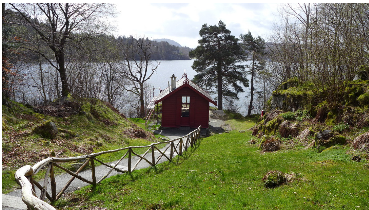
Figur 21: Edvard Griegs komponisthytte ble plassert i Trolddalen. Der kunne han arbeide uforstyrret, også når villaen var fylt av sommerlig aktivitet. (Foto: Byantikvaren 2015).