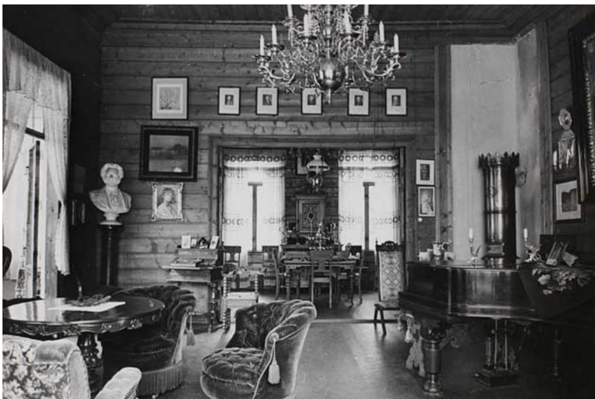
Figur 14: Dagligværelse/stue i villaen på Trolldhaugen. Ukjent tidspunkt.

Alle de innvendige veggene er ubehandlet og forsiktig profilert maskinlaft. Gulvene har ulike overflater med tepper, tregulv eller linoleum. Opprinnelig var det hvitskurte tregulv. Alle innvendig dører er brunbeisede og lakkerte, likeså trappene. Også vinduene er ubehandlet på innsiden. De bare veggene kan leses som et subtilt signal som skulle fortelle om den uformelle omgangstonen og de forenklede konvensjonene som var forventet fra et samvær «på landet». (Nordhagen, 2006)