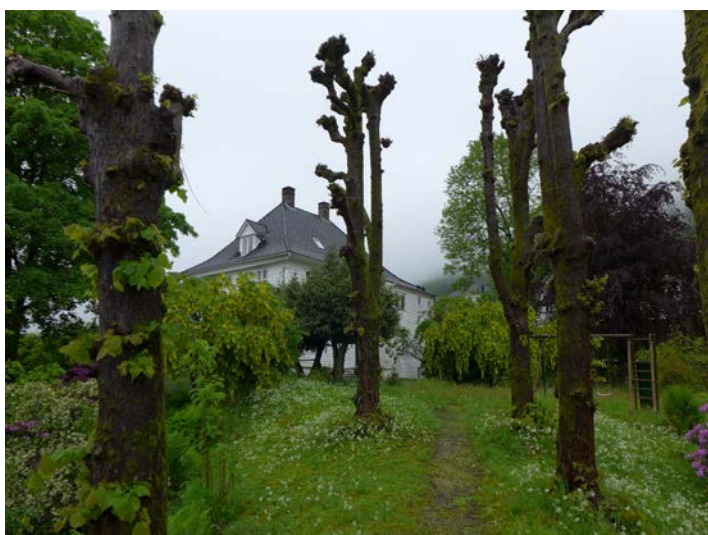
Figur 22: Uteområdet på sørsiden av huset er preget av en liten lindeallè som leder ut til et utkikkspunkt med utsyn over Bergensdalen mot syd (Byantikvaren 2015).

Vi kjenner lite til hageanlegget til det tidligste huset. Landås Hovedgård hadde på 1800-tallet et stort parkanlegg anlagt da det ombygde huset stod ferdig i 1810. Parken ble anlagt etter datidens hageideal; « den engelske landskapsparken», en stor park med stier, benker, karussedammer og kjørevei opp fra Landåsveien. Det refereres også til en mer formell hage. I brev fra Fortidsminneforeningen til reguleringsrådet i Bergen av 31.10.1951 heter det at « Hagen har i sin nåværende form bevart karakteren fra rokokkotiden og hører til et av de anlegg som fremheves i C.W Schnitlers bok om norske haver. Samspillet mellom den vakre gamle bygningen, den sirlige hagen og det kuperte terrenget er av enestående virkning og hører til de verdier som bør søkes bevart mest mulig intakt også av hensyn til den nye bydelen som vokser opp. » Det meste av dette området ble utbygget på 1950-tallet, men spor er bevart, først og fremst i den generøse hagen rundt huset. Gatenavnet Kanonhaugen fra 1954 er knyttet til den lille saluttkanonen som var plassert på utkikkspunktet på Landås Hovedgård (figur 23).