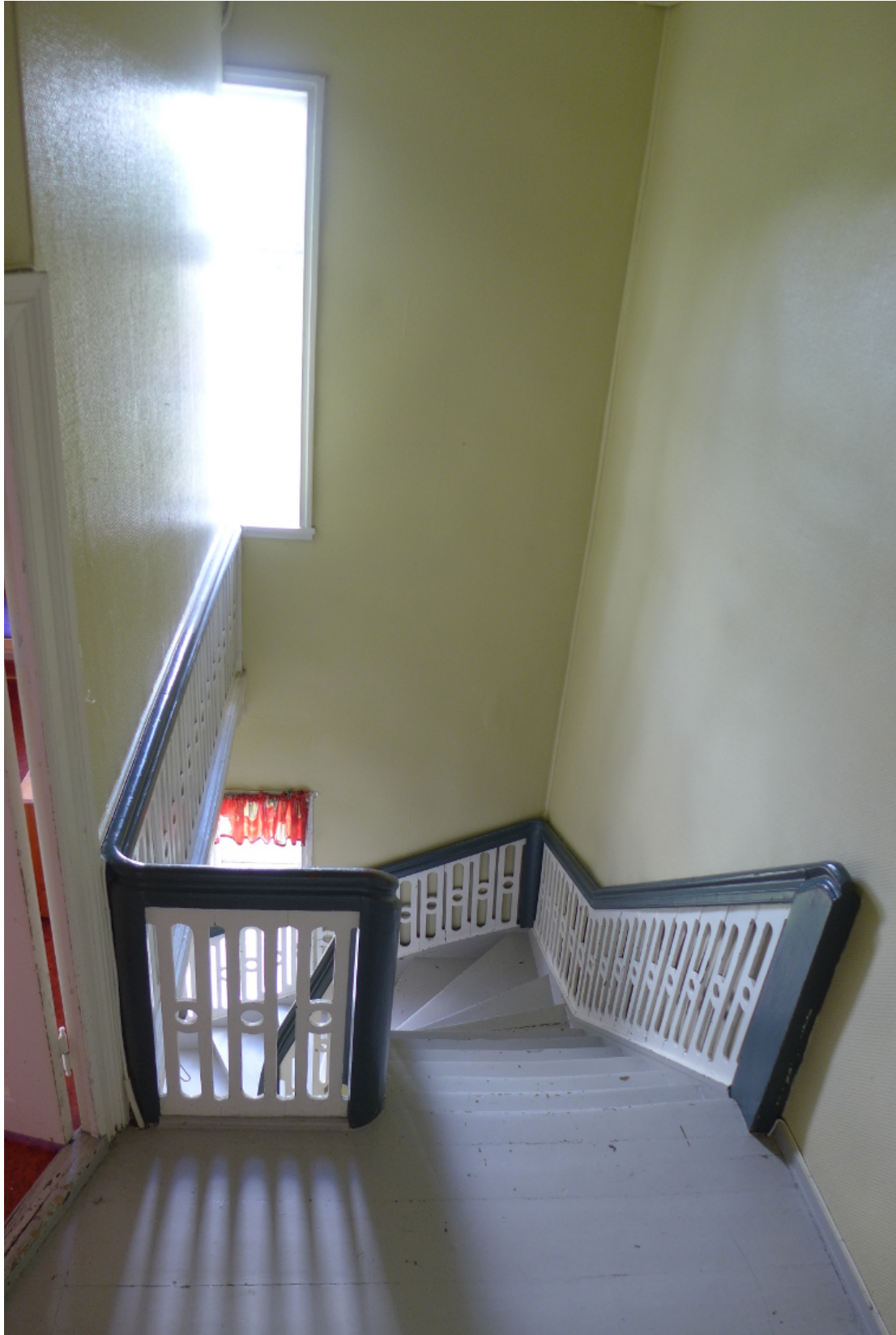
Figur 21: Hovedtrapperommet på østsiden av huset (Byantikvaren 2015).