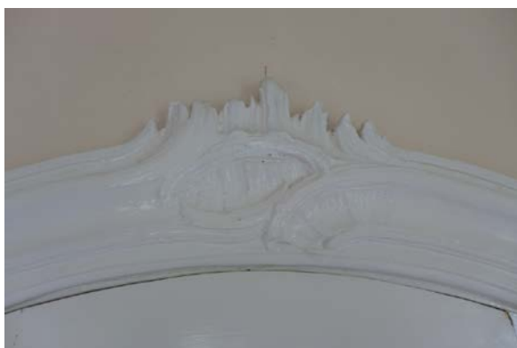
Figur 15: Rokokkodetalj på dørkarm i salen (Byantikvaren 2015).