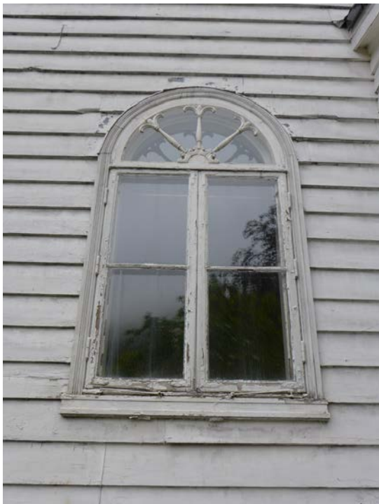
Figur 12: Rundbuet empirevindu på sørøstsiden av huset, i første etasje.