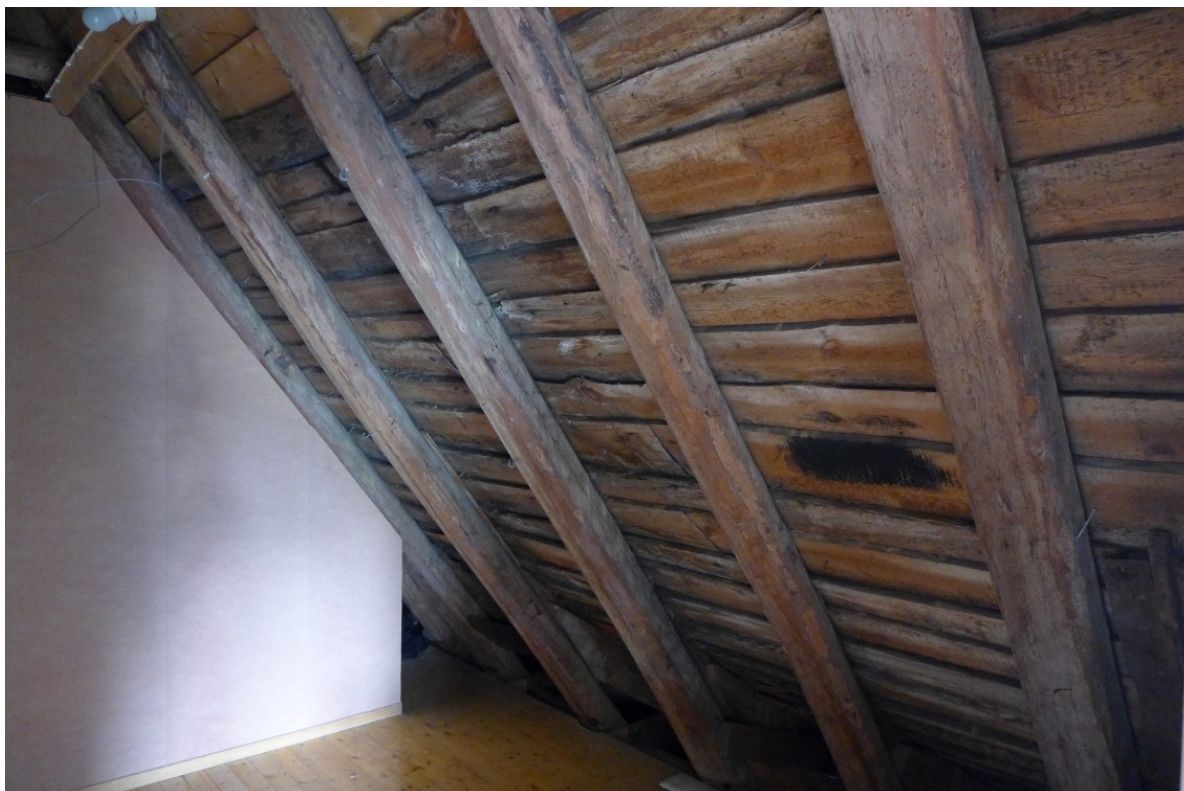
Figur 20: Taket har bærende konstruksjoner i tre og er bygget opp som et sperretak av tømmer (Byantikvaren 2015).