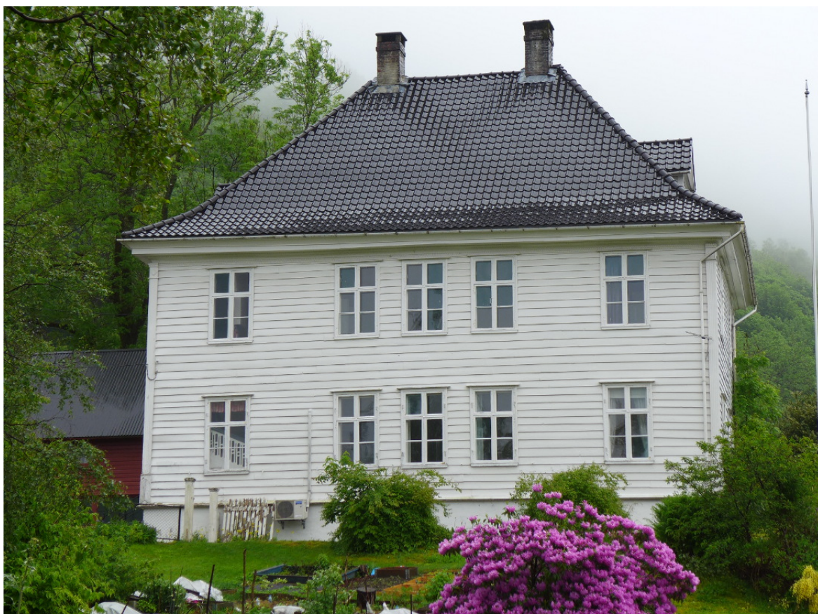
Figur 9: Fasaden har et gjennomført klassisistisk preg med en stor rektangulær hovedform, valmtak med svai og store vinduer fordelt på hele hovedfasaden.

Etter Hagerups ombygging ca 1810 ble interiørets ornamentikk dels barokk og rokokko, dels Louis-seize og empire, mens fasaden fikk et gjennomført klassisistisk preg, med en stor rektangulær hovedform, valmtak med svai og store vinduer fordelt på hele hovedfasaden i en én-tre-én rytme i begge etasjer (figur 9). Mot sørøst er en utgangsdør til hagen i empirestil og et senere smalt tilbygg i 2 etasjer med asymmetriske vindusplasseringer. Mot nordøst er vognhuset bygget som et tilbygg, vinkelrett på hovedvolumet. Fasadene mot nordvest og sørvest har empirevinduer fra Hagerups ombygging. Fasaden mot sørøst har vinduer av varierende utseende og alder, hvorav vinduene i første etasje på hovedvolumet er gitt en svært forseggjort utforming. Nordøstfasaden har store rokokkovinduer. En bratt trapp med skiferbelegg leder opp til hovedinngangen med empireportal på nordøstfasaden.