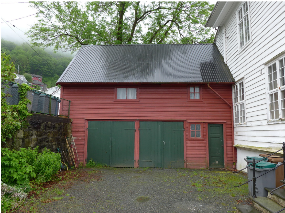
Figur 7: I 1897 fikk huset et tilbygg mot sørøst i halve husets lengde og en større stall- og vognbygning i forlengelse av huset østover.

Brødrene Wollert og Danckert Krohn overtok eiendommen fra familie i 1771 og gjorde da en del endringer på eiendommen. Vi kjenner lite til hvilke endringer de gjorde, men blant annet ble en barokkportal flyttet og ny hagedør satt inn. Dette er omtrent samtidig med at Damsgård Hovedgård, vårt mest kjente «rokokkopalé», fikk sin form slik vi kjenner den, og dette kan kanskje gi en pekepinn om tidens stil og smak i de bergenske lystgårdene på slutten av 1700-tallet. For eksempel er Krohn-brødrenes doble rokokkodør et stilistisk praktstykke med sterkt slektskap til lignende dører på Damsgård. Det var også Danckert Krohn som stod bak «Danckert Krohns Stiftelse», omsorgsinstitusjonen i Kong Oscars gate. Bygget i 1789 og også dette med mange likhetstrekk med Landås i interiørdetaljer («Danckert Krohns Stiftelse» eies også av Bergen kommune).