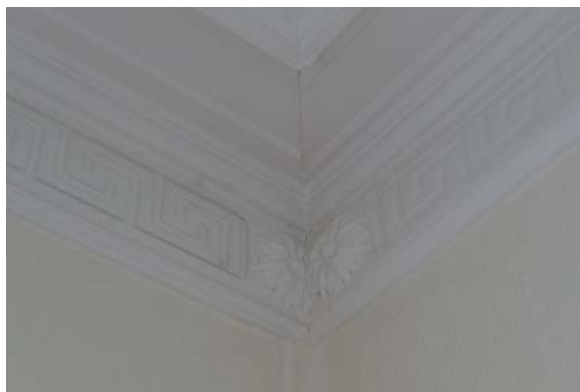
Figur 16: Lister med Louis-Seize-detalljer (Byantikvaren 2015).

Fra slutten av 1600-tallet finnes det også en barokk hagedør/portal. Portalen ble på 1770-80-tallet flyttet til et annet rom og erstattet med en ny dør etter at brødrene Wollert og Danckert