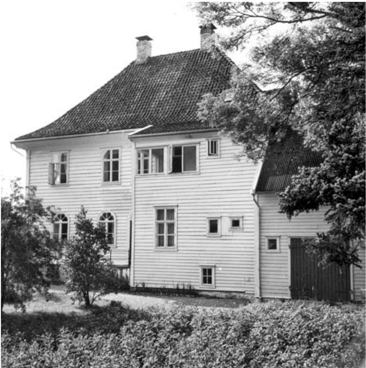
Figur 5: Sørøstfasaden til Landås hovedgård fotografert i 1959.

ellers. Griegs barndomshjem i Strandgaten ble ødelagt ved eksplosjonen på Vågen i 1944. Det var på Landås Ole Bull oppdaget 15-åringens store musikalske talent og rådet foreldrene til å la ham studere ved konservatoriet i Leipzig. Elleve år senere, i 1869, tilbrakte Nina og Edvard Grieg sommeren på Landås da deres eneste barn, datteren Alexandra, ble rammet av hjernebetennelse og døde, bare 13 måneder gammel. Etter denne tragedien satte Grieg musikk til "Millom rosor" av Kristofer Janson, et dikt som nettopp skildrer en mors sorg ved sitt barns død. Også den meget populære klaverkomposisjonen "Brudfølget drar forbi" ble til på Landås. Familien eide Landås til 1873. Da var Edvard 30 år og det var 12 år før hans og Ninas Trolldhaugen stod ferdig.