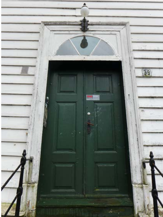
Figur 10: Hovedportal på nordøstsiden av huset (Byantikvaren 2015).

hele gesimsen. Gesimsen, som løper rundt hele bygningen, er profilert og relativt kraftig, understreket av svaien nederst på taket.