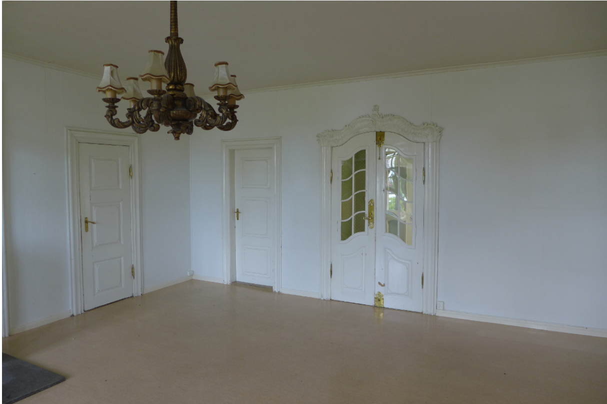
Figur 17: Rokokkoen gjorde sitt inntog i bygningen på andre halvdel av 1700-tallet, blant annet i form av denne nye portalen og døren i salen. (Byantikvaren 2015).

Krohn hadde overtatt familieeiendommen i 1771. Rokokkoen gjorde da sitt inntog i bygningen, blant annet i form av denne nye portalen og døren i salen. Vi vet ellers lite om hvilke endringer brødrene gjorde, men små spor i interiørdetaljer finnes fortsatt rundt i huset, som dører, lister og beslag. Hagedøren ble en innerdør ved påbyggingen i 1810, og en ny empirodør ble utgang til hagen. Begge dørene er fortsatt intakte. Det er også en rekke eldre dører, lister og bygningsdetaljer i bygningen. Veggoverflater og gulv i leilighetene er av nyere dato, men det er all grunn til å forvente at disse skjuler eldre overflatelag.