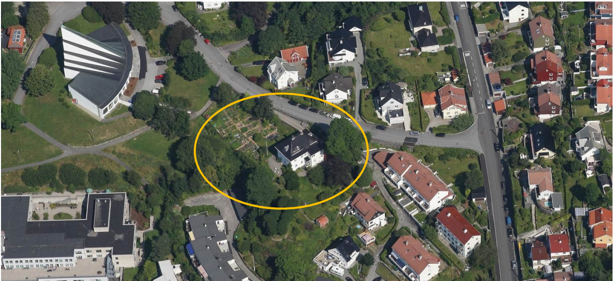
Figur 2. Flyfoto av området. Landås hovedgård er ringet inn med gult.