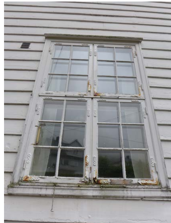
Figur 13: Rokokkovindu på nordøstsiden av huset.