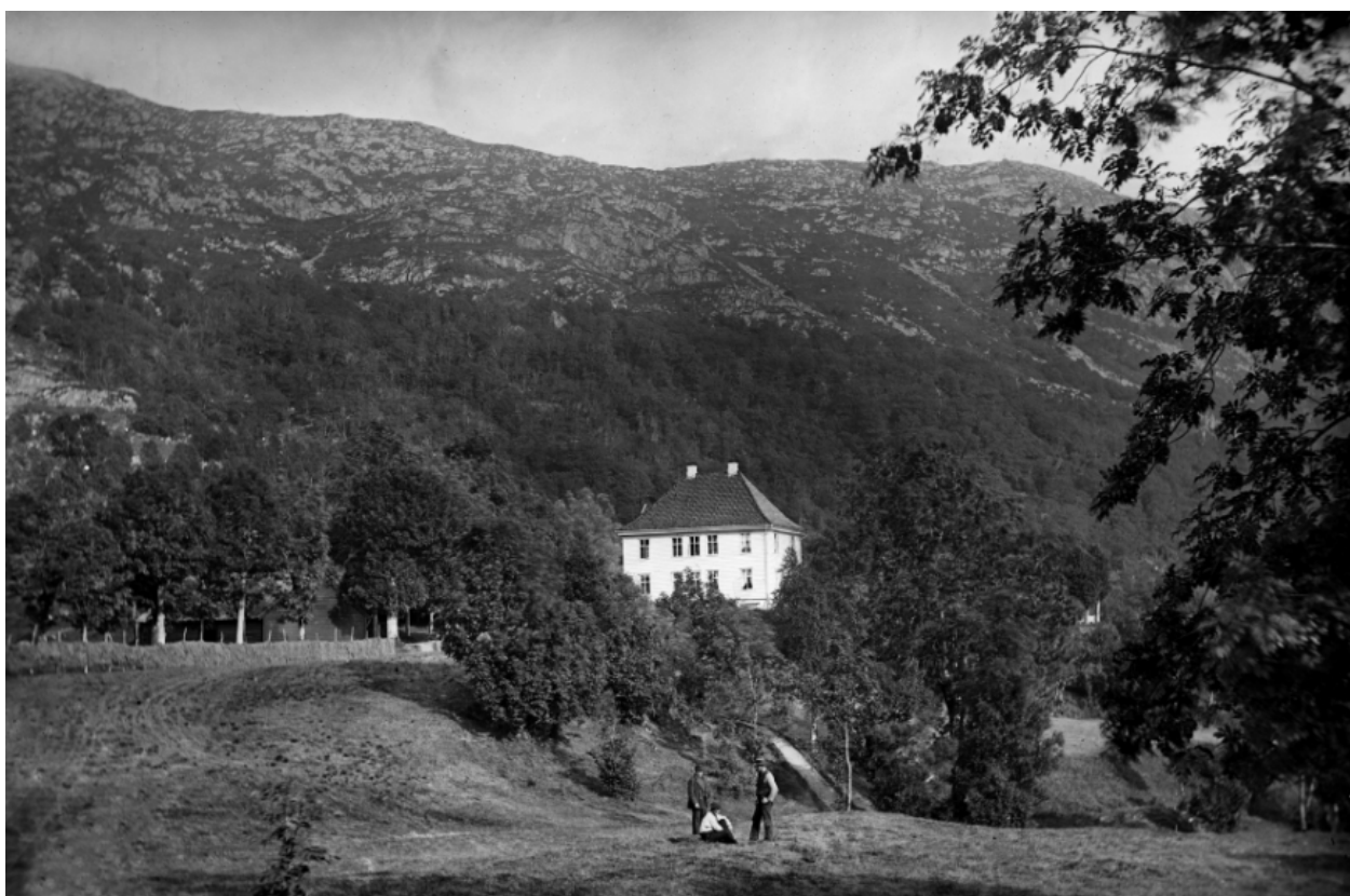
Figur 1: Landås hovedgård i 1870-årene.

Landås er en gammel gård i tidligere Årstad herred, plassert i nordvestskråningen av Landåsfjellet. I middelalderen hørte gården til under kongsgården på Alrekstad, senere Årstad. På et tidspunkt gikk store deler av jordeområdene over i kirkens eie, drevet av byens klostre. Etter reformasjonen på 1500-tallet gikk disse eiendommene over i kongens eie, som igjen solgte dem videre på 1600-tallet. Vincens Lunge kjøpte det meste av eiendommene sør for byen. Landås grenset opp til Haukeland i nord og Slettebakken i sør. Sammen med Haukeland ble Landås skilt ut fra Lungegården i 1645 og solgt til Peder Paasche. Først i 1850 ble de to gårdene skilt fra hverandre. Med tiden ble eiendommen gradvis mindre, ved at jordstykker og underbruk ble solgt, og ved at eiendommen ble delt mellom flere arvinger. I dag består hovedgården av våningshus og en stall/vognskjul, samt en liten del av hagen. Resten av gården ble utbygget i den storstilte byutviklingen i etterkrigstiden.