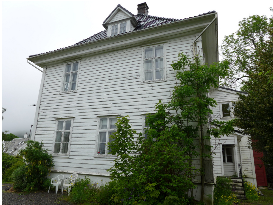
Figur 8: Hovedbygningen er i hovedsak en tømret konstruksjon, utvendig kledd med liggende panel og med enkle klassisistiske detaljer fra tidlig 1800-tall. Her fra sørvestfasaden.

Hovedbygningen er i hovedsak en tømret konstruksjon, utvendig kledd med liggende panel og med enkle klassisistiske detaljer fra tidlig 1800-tall. Det er kjeller under deler av huset, bygget i naturstein og kalket. Kjellergulvet er hellelagt. Taket har bærende konstruksjoner i tre og er bygget opp som et sperretak av tømmer. Yttertak er oppført som et valmtak med en sterk svai ved gesims, et lokalt arkitekturhistorisk trekk som også omtales som «Bergens-svai» eller «Kina-vipp». Taket med en liten ark mot nordøst og en nyere ark mot sørvest, er teknet med sort glasert takstein.