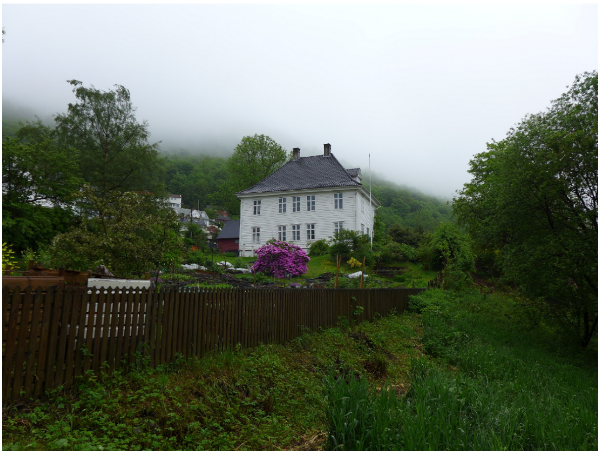
Figur 6: Landås Hovedgårds hovedbygning er fremdeles et godt synlig landemerke i området.

Landås Hovedgårds hovedbygning er fremdeles et godt synlig landemerke i området og et av Bergens fremste kulturminner. Hovedbygningen og vognskjulet ble fredet i mai 1927, etter lov om bygningsfredning fra 1920.