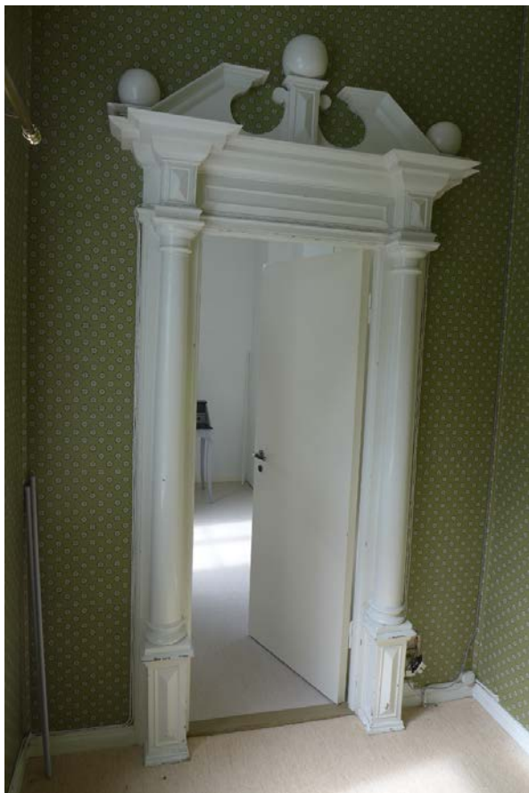
Figur 18: Barokk dørportal i første etasje (Byantikvaren 2015).