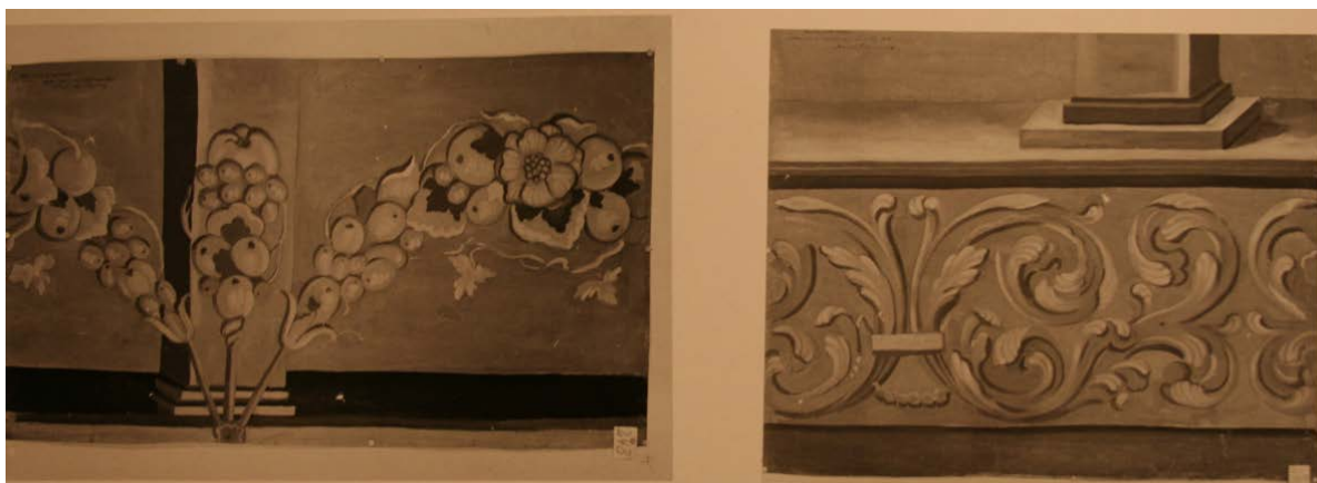
Figur 14: Trolig på 1680-tallet, da huset fremdeles var ganske nytt, ble salens vegger dekorert med akantusranker, søyler og fruktranker i barokk stil.

Planløsningen til våningshuset er preget av husets brokete bygningshistorie og er asymmetrisk og «krongete» med rom på rom og mange gjennomganger. De siste 50 år har huset vært innredet med to boenheter, en i hver etasje, samt kjeller og loft med delvis bruksrom og delvis utrom/tørkeloft. Trolig på 1680-tallet, da huset fremdeles var ganske nytt, ble salens vegger dekorert med akantusranker, søyler og fruktranker i barokk stil. Dekoren er malt direkte på tømmerveggene og finnes ennå, helt eller delvis, beskyttet bak veggplater montert i 1955. Der finnes beskrivelser og tegninger av dette (Figur 14). Der nevnes også senere tapet. Disse er trolig ødelagt, men har beskyttet barokkdekoren fra 1600-tallet. Vi vet ikke hva som ellers befinner seg bak de moderne overflatene, men det er grunn til å tro at en bygningsarkeologisk undersøkelse vil avdekke flere detaljer.