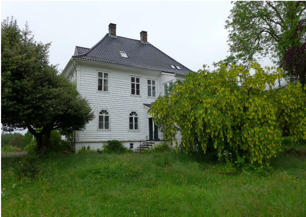
Figur 4: Sørøstfasaden til Landås hovedgård i dag.