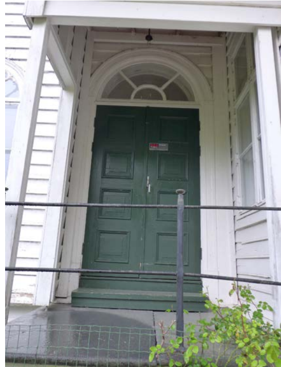
Figur 11: Empiredør med utgang til hagen. (Byantikvaren 2015).