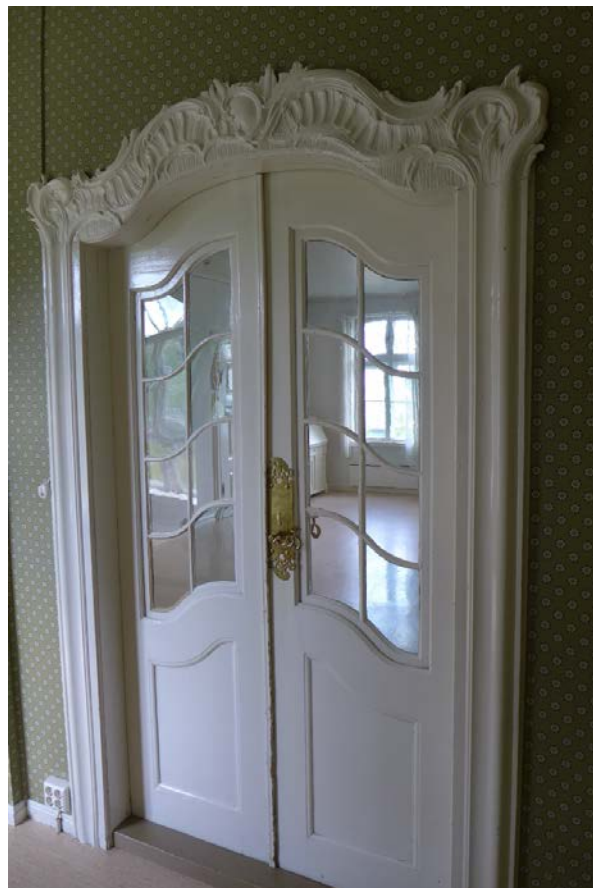
Figur 19: Rokokkodør inn til salen (Byantikvaren 2015).