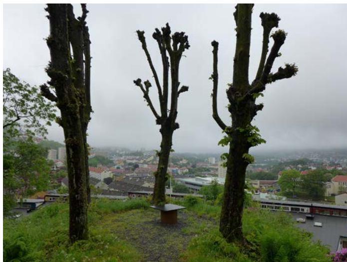
Figur 23: Gatenavnet Kanonhaugen fra 1954 er knyttet til en liten saluttkanon som tidligere var plassert på utkikkspunktet på sydsiden (Byantikvaren 2015).