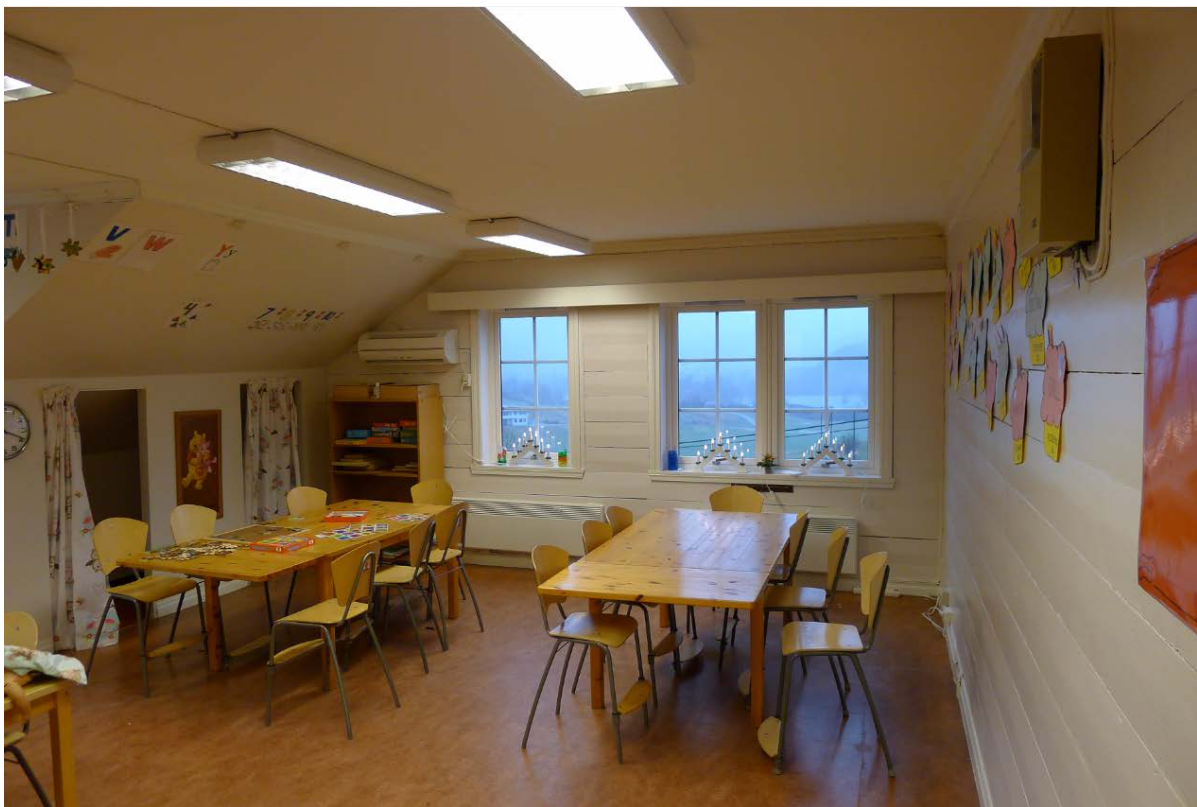
Figur 14. Rommene er stort sett endret innvendig (Foto: Byantikvaren 2015).