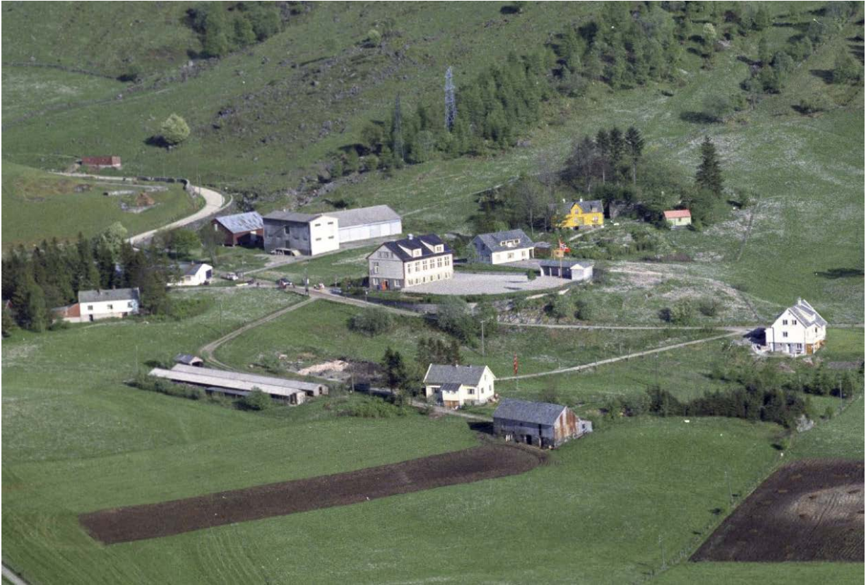
Figur 1. Unneland skole og bygningsmiljøet omkring i 1961.