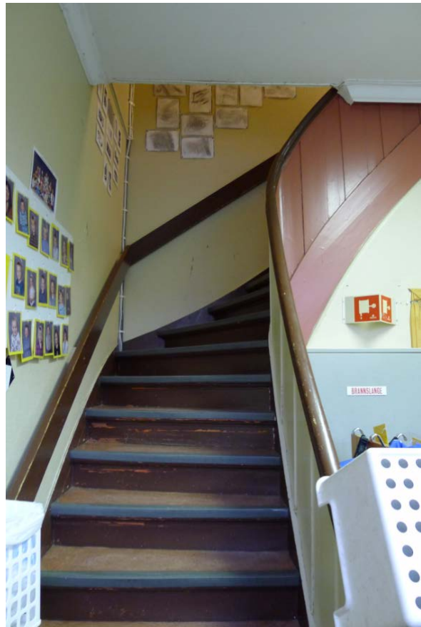
Figur 13. Trappeløpet er også originalt.