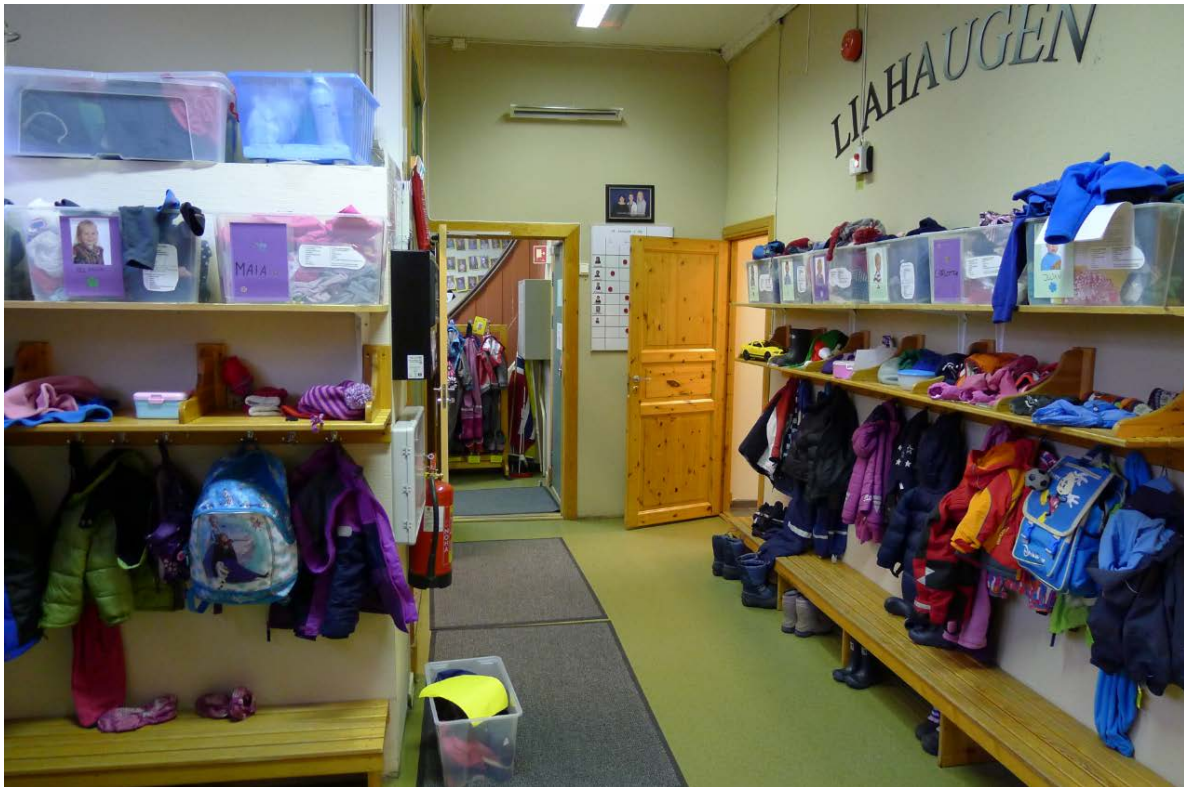
Figur 15. Interiøret er preget av dagens bruk.(Foto: Byantikvaren 2015).