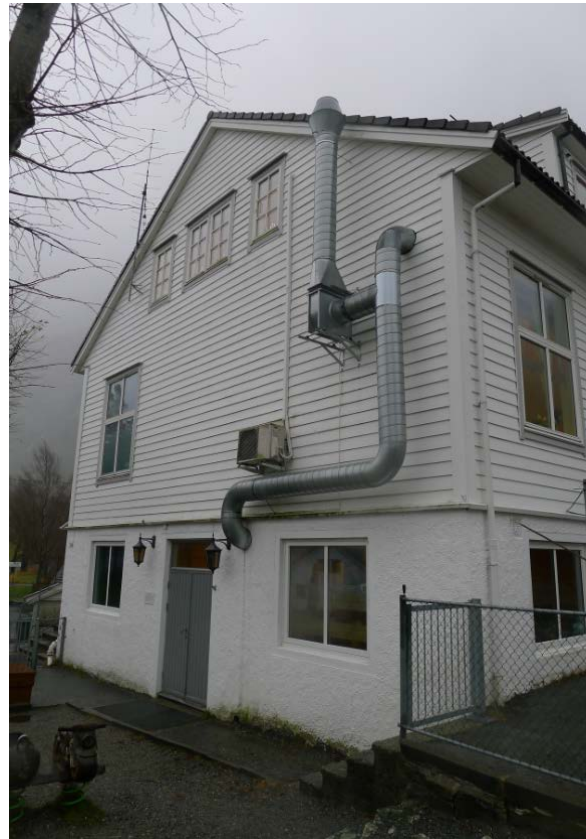
Figur 9. Gavlvegg mot nord (Foto: Byantikvaren 2015).