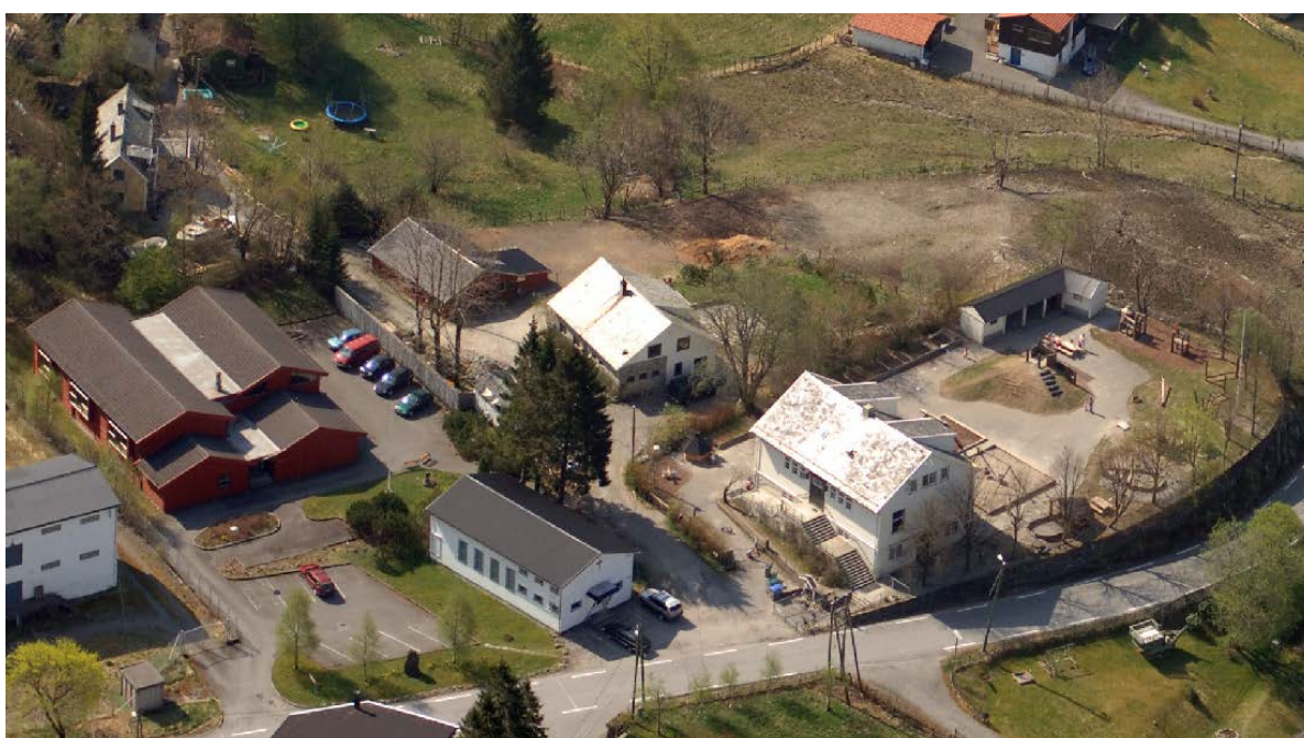
Figur 4. Unneland barnehage og bygningsmiljøet omkring i 2006. Det «nye» tilbygget fra 1984, er den røde til venstre i bildet.