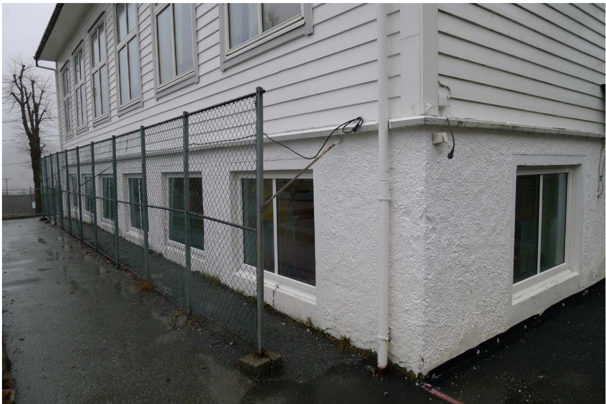
Figur 10 Beskyttelse av bygningen mot ballspill i form av et høyt gjerde.(Foto: Byantikvaren 2015).