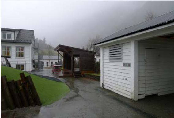
Figur 16. Nytt og gammalt uværskur.

Uværskuret sørvest på skoleplassen er originalt fra da skolen ble bygget. Skolegården har samme utstrekning og form som opprinnelig, men har fått flere lekeapparater i dag. Skolehuset og uteområdet ligger på en høyde i terrenget, opparbeidet mot Unnelandsvegen med murer, trolig fra oppføringen av skolehuset.