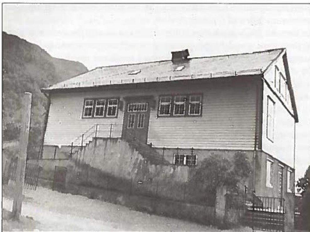
Figur 5. Like etter at Unneland skole ble oppført i 1940 ble bygningen tatt i bruk av den tyske okkupasjonsmakten.

Unneland skole, Unnelandsveien 245, var tidligere barneskole (1.-7. klasse), oppført i 1940. Et tilbygg til skolen, tegnet av arkitekt Edel Eikeseth, ble oppført i 1984. Skolen ble nedlagt i 1997 og elevene overført til Lone skole. Den nye skolebygningen (figur 4) ble i 2004 solgt av Bergen kommune til Losje St. Olav, som blant annet benytter lokalene til barnehage.