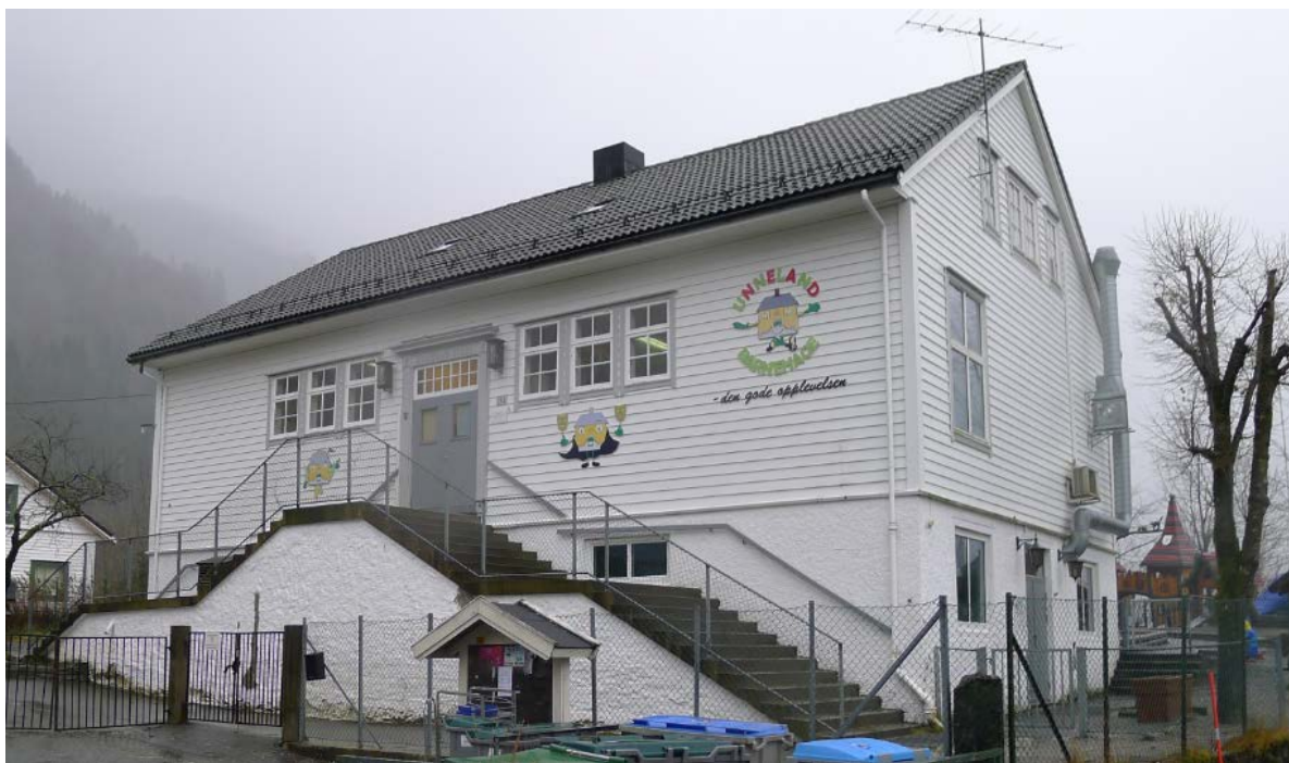
Figur 3. Inngangsfasaden til bygningen.

Bygningen ble oppført som skolestue i 1940. Bakgrunnen var at det første skolehuset på Unneland var for lite. Da krigen kom og veterinærstasjonen ble bygget like ved, ble skolens bad og gymnastikksal tatt i bruk av tyskerne. Skolen ble etterhvert levert tilbake til sivilformål. Skolen var i noen år småskole, men fikk 4-7 klasse tilbake i 1972. Bygningen ble bygget om i 1984 da det også kom til et nytt skolebygg like ved, tegnet av arkitekt Edel Eikeseth (figur 4).