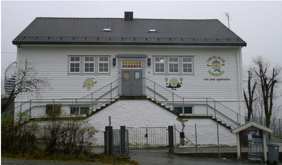
Figur 7. Østfasaden til bygningen.

De andre fasadene er stort sett endret. Sørfasaden domineres av en utenpåliggende galvanisert nødutgang og trapp, mens nordfasaden har både varmepumpe og godt dimensjonert utenpåliggende ventilasjonsanlegg. Vestfasaden har samme vindusindeling som vi finner på tidligere tegninger og fotografier. De to arkene finner vi også på tegningene. Vinduene er skiftet og erstattet med nyere vinduer. Eldre foto viser mindre ruter i de store vinduene. Taket er skiftet med svart takstein. Det er ikke klart hva som var opprinnelig takmateriale, men sannsynligvis var det skifer.