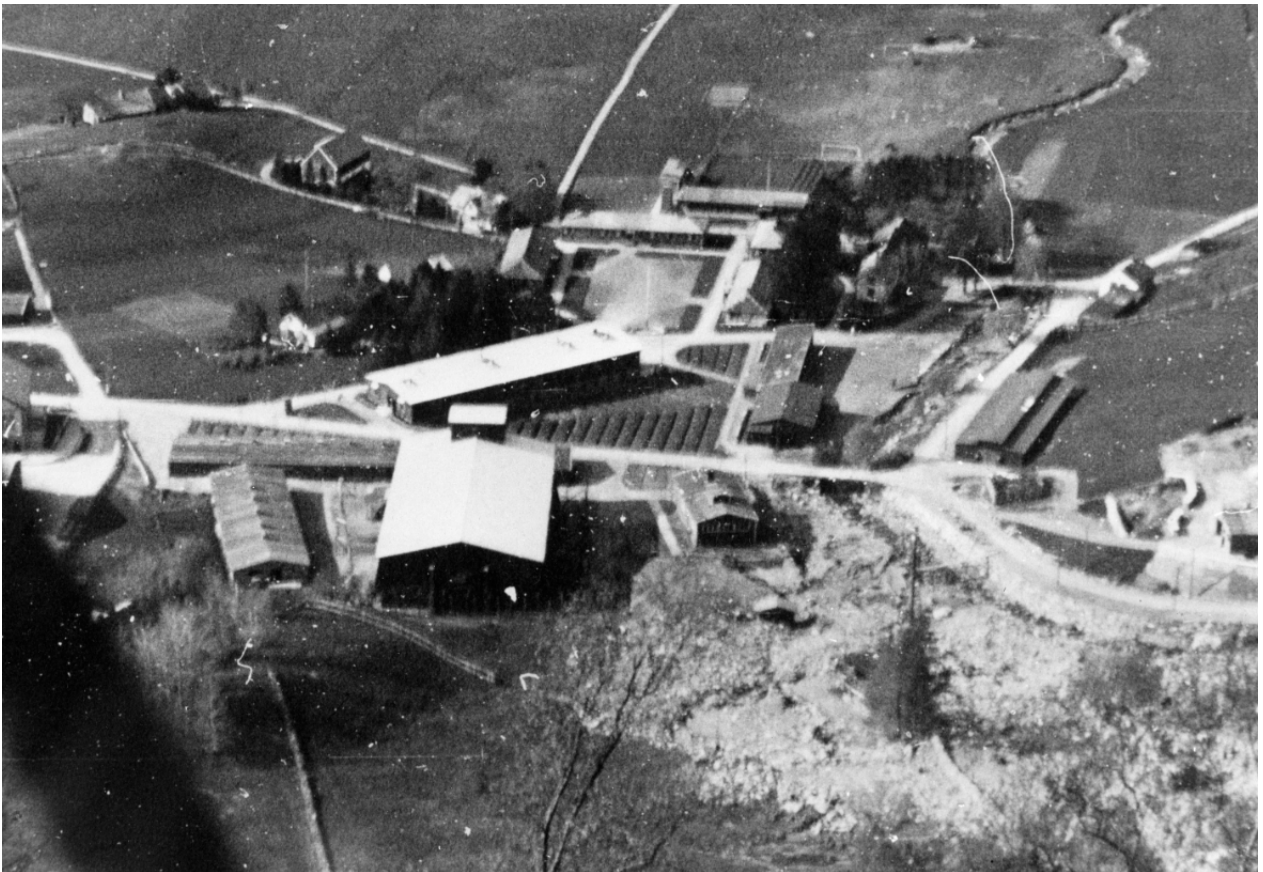
Figur 2. Den tyske militærleiren på Unneland under krigen. Unneland skole helt i venstre bildekant.