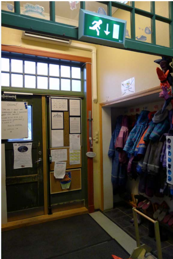
Figur 12. Inngangsparti, med nisjer og opprinnelige overglass. (Foto: Byantikvaren 2015).