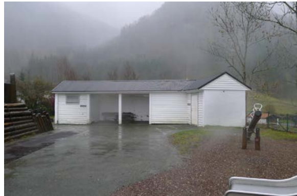
Figur 17. Det eldste uværskuret.