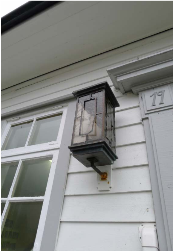
Figur 8 Original lampe.