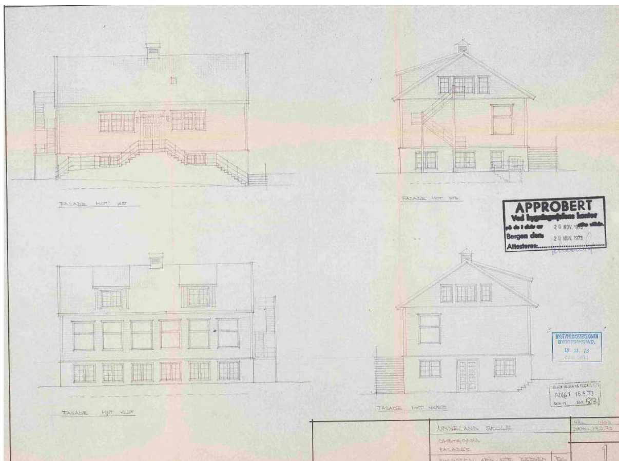
Figur 11: Tegninger fra Bra Arkiv, fra 1973. Her ser vi at fasaden har fått den utformingen som i dag. Bortsett fra at vinduer på fasade mot vest er skiftet.