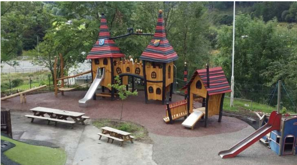
Figur 18: Lekeapparater i barnehagens uteområde (Foto: http://www.minskole.no/MinBarnehage/unneland ).