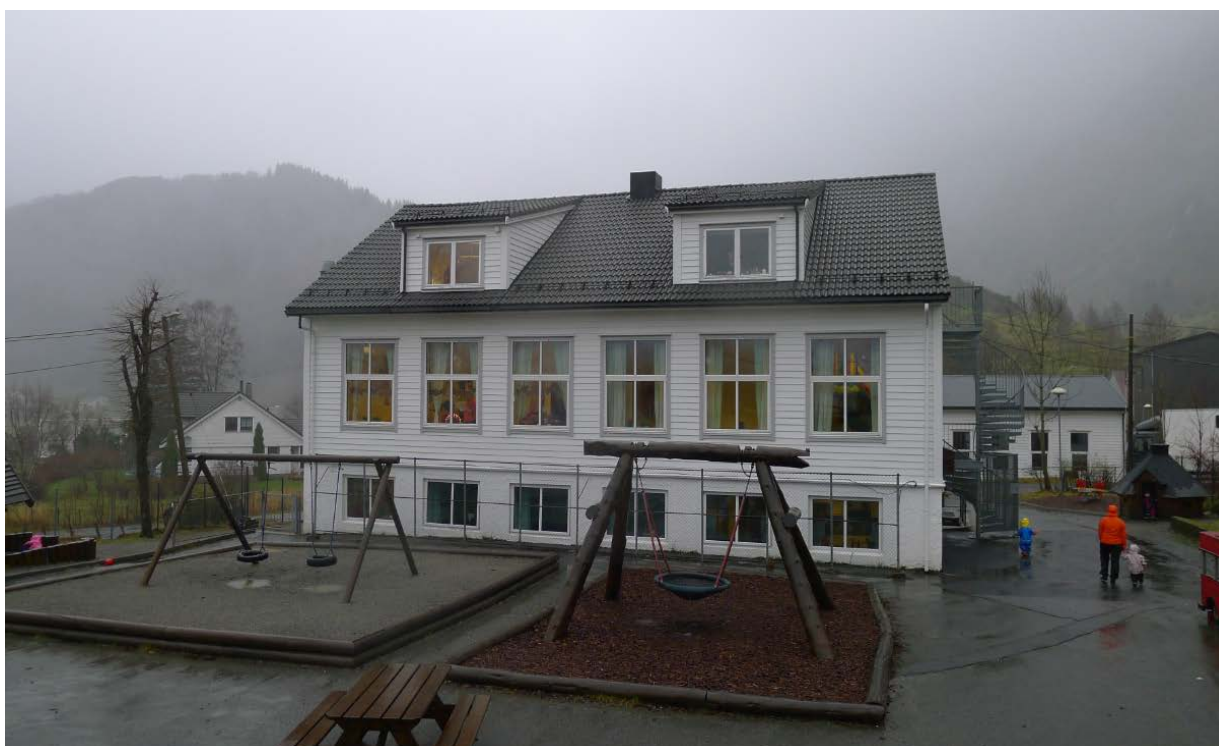
Figur 6. Vestfasaden til bygningen (Foto: Byantikvaren 2015).

Fasade mot øst (inngangsfasaden) har bevart det opprinnelige uttrykket. Den majestetiske trappen opp til inngangen er den opprinnelige. Portalen rundt døren er bevart samt vinduene på hver side av inngangen. Portalen er bevart med innskrift om alder og Unneland skole. Glasspartiet over døren er også bevart mens døren dessverre er skiftet med en nyere. Utelampene på hver side av inngangen ser ut til å være originale.