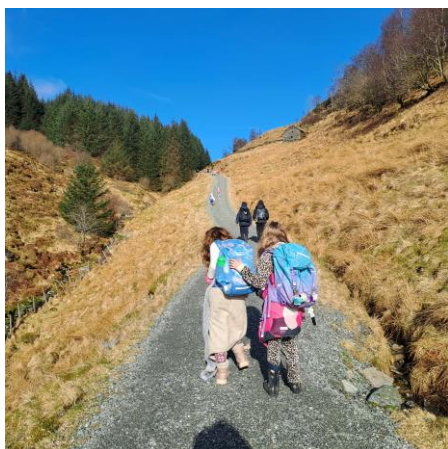
Tur til Magnusløa langs postveien og lek i skogen.