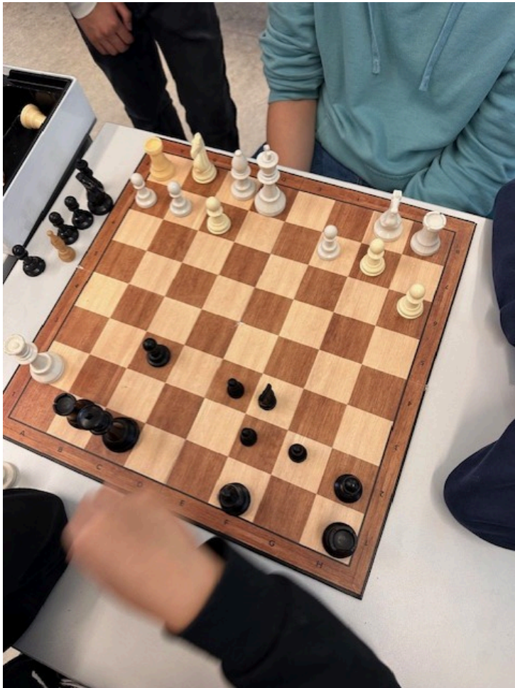
Bilder fra uke 13: