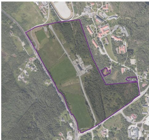
Figur 7. Kommunal eid eiendom

Haukås gård (gnr/bnr 199/10) er en stor kommunal eiendom med blant annet en driftsbygning og et våningshus (figur 7). Eiendommen har i mange år vært utleid til Bergen og Omegn Travelskap (BOT). Driftsbygningen brukes til stall av breddemiljøet og unge aktive innen hestesporten. Området er anlagt med mange luftegårder, samt en rettbane (treningsbane) for hest (figur 8). Rettbanen brukes i hovedsak av det profesjonelle miljøet knyttet til travparken.