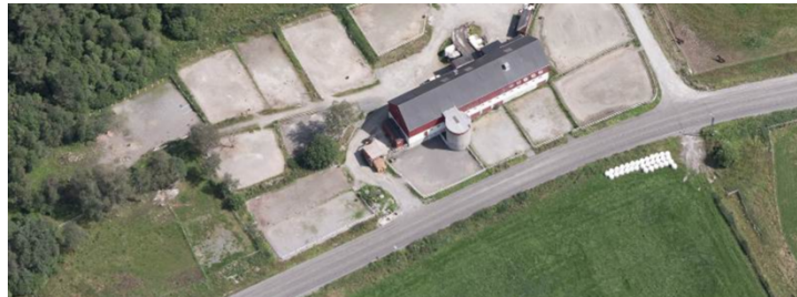
Figur 8. Haukås gård

Rettbanen og flere av luftegårdene er ulovlig etablert på kommunal grunn . Banen ligger tett på elven over en lang strekning, og bidrar med alvorlig tilførsel av partikler (fin sand) og næringsstoffer (fra hestemøkk). Konflikten i forhold til vannmiljøet har vært kjent lenge, og er alvorlig.