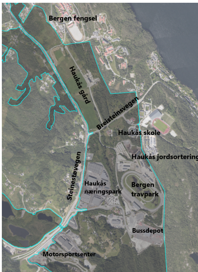
Figur 1 og 2. Oversikt over planområdet