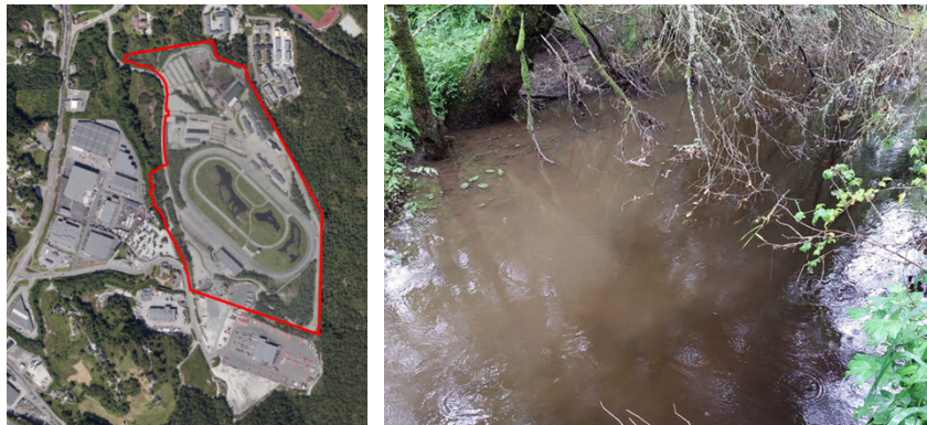
Figur 5. Bergen travpark og Haukås jordsortering. Figur 6. Nedstrøms Travparkbekken og hovedvassdraget, på en dag med moderat nedbør.

Begge aktørene har bidratt til mye og alvorlig forurensning til vassdraget, særlig knyttet til næringsstoffer fra hestemøkk og partikkelavrenning fra store arealer med svært finkornet sand. Periodevis kan det være ekstremt høye nivåer av næringsstoffer og partikler i elven, særlig i regnværsperioder (figur 6).