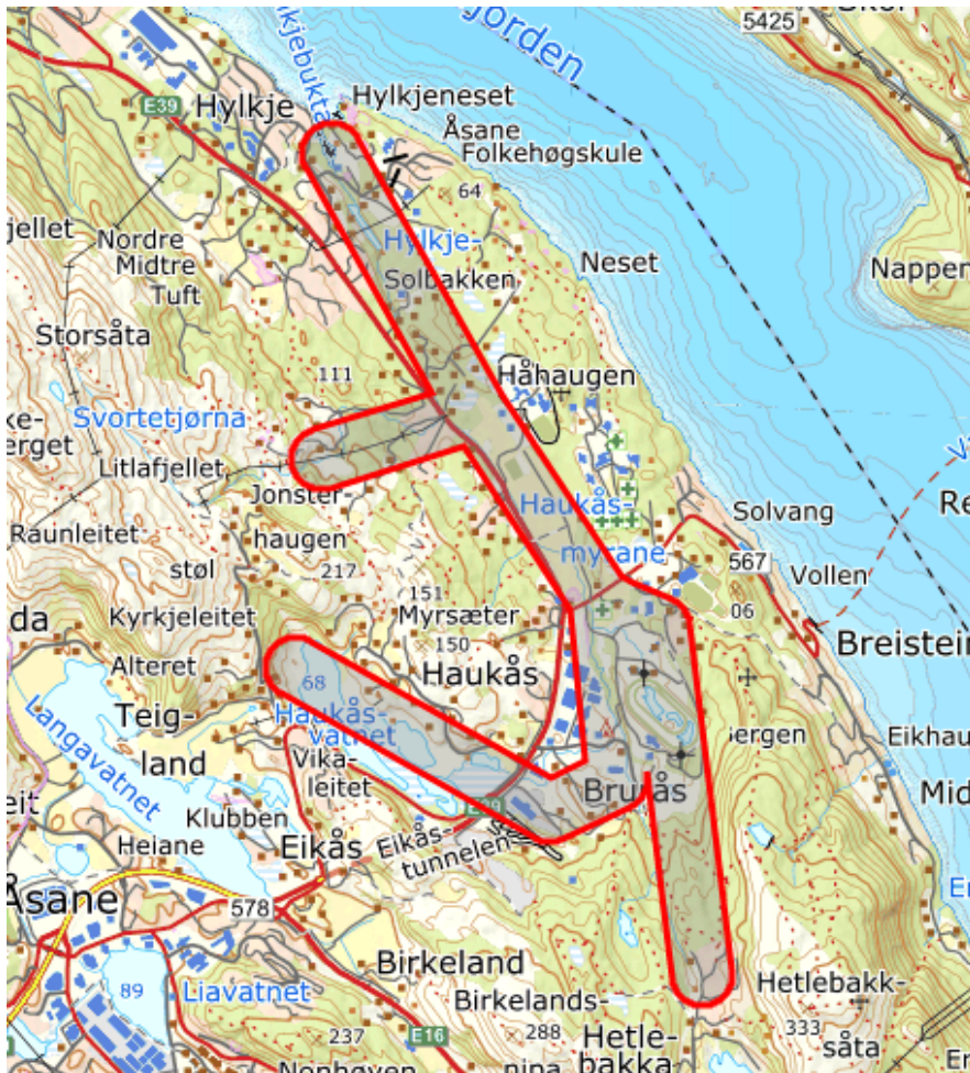
Planområdet – skjematisk illustrert, sjå side 4 for ei meir presis avgrensing

Enkelte andre tiltak er under planlegging i offentlig regi og uavhengig av reguleringsplanen, dette gjeld særleg våtmarksrestaurering på Haukås gard og tiltak i Travparkbekken. Planforslaget inneheld også nokre nye tiltak som ikkje har direkte samband med planen sitt hovudformål. Dette gjeld særleg: