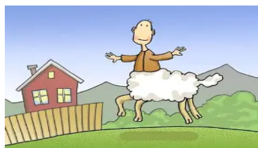
Oddvar er lam fra livet og ned