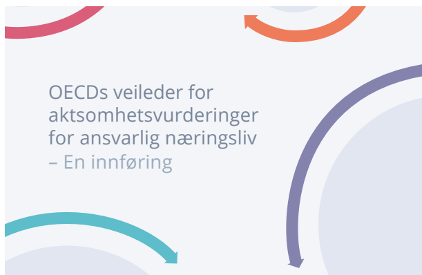
OECDs veileder for aktsomhetsvurderinger.

Bergen er kjent som en internasjonal handelsby hvor havnæringene står spesielt sterkt. Næringslivet bidrar positivt mot flere bærekraftsmål. Samtidig møter selskaper på etiske utfordringer i krevende markeder. Visse områder er forbundet med høy risiko for at det skjer krenkelsener. I sektorer som bygg- og anlegg, transport, tekstil, elektronikk og mat/drikke er det dokumentert flere tilfeller av uanstendige arbeidsforhold og belastninger på lokalsamfunn og miljø. 2 Faren for menneskerettighetsovergrep er også stor i lavkostland og i konfliktområder.